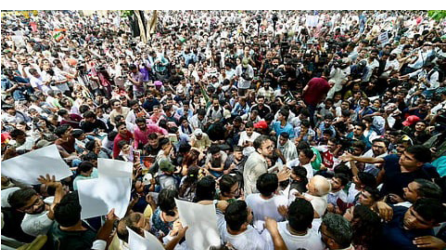
आला असल्याचे काही राजकीय जाणकारांचे मत आहे. नीट पेपरफुटी प्रकरण आणि वाढत्या बेरोजगारीच्या मुद्द्यावरून देशातील तरुणांमध्ये तीव्र संताप निर्माण झाला आहे. या पार्श्वभूमीवर युवकांच्या रोषाला सोबत घेत 'काँग्रेस' जनता पार्टीने दिल्लीत केंद्र सरकारविरोधात मोठे आणि आक्रमक आंदोलन छेडले. या

पुणे/बीड : देशात नीट पेपरफुटी प्रकरण आणि वाढती बेरोजगारी या गंभीर मुद्द्यांवर काँग्रेसने आक्रमकपणे आवाज उठवणे अपेक्षित असताना, काल्पनिक वाटणारी पण प्रत्यक्षात रस्त्यावर उतरलेली 'काँग्रेस' जनता पार्टी पुढे आल्याने देशाचे लक्ष या आंदोलनाकडे केंद्रित झाले आहे. या आंदोलनामुळे उद्या केंद्रीय शिक्षणमंत्री धर्मंद प्रधान यांचा राजीनामा झाला, तरी त्याचे श्रेय काँग्रेसला नव्हे तर 'काँग्रेस' जनता पार्टीला जाईल, अशी चर्चा राजकीय वर्तुळात रंगू लागली आहे. काँग्रेसला श्रेय मिळू नये यासाठीच सत्ताधाऱ्यांकडून हा 'काँग्रेस' प्रयोग' राबविण्यात