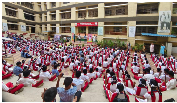
अत्यंत उपयुक्त आहे. यंदाच्या ‘निरोगी वृद्धत्वासाठी योग’ या संकल्पनेतून विद्यार्थ्यांमध्ये

नोंदविला. विशेष बाब म्हणजे, आंतरराष्ट्रीय योग दिन यंदा रविवारी आला असतानाही विद्यार्थ्यांनी उत्स्फूर्त प्रतिसाद देत मोठ्या संख्येने शाळांमध्ये उपस्थिती दर्शविली. सुट्टीचा दिवस असूनही विद्यार्थ्यांनी स्वखुशीने सहभाग नोंदवत योगाबद्दलची जागरूकता आणि उत्साह दाखवून दिला. योग हा भारतीय संस्कृतीचा अमूल्य वारसा असून शारीरिक, मानसिक आणि भावनिक आरोग्य जपण्यासाठी तो