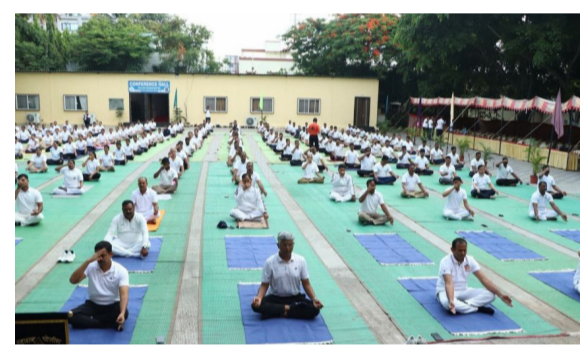
असलेल्या पोलीस दलावरील ताणतणाव कमी करण्यासाठी आणि निरोगी जीवनशैलीचा अंगीकार करण्यासाठी या सत्राचा लाभ झाला. पुणे येथील अनुभवी व अधिकृत योग प्रशिक्षकांच्या