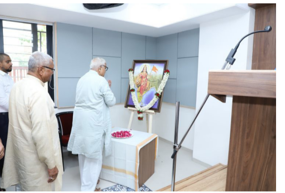
जोशी यांनी ज्येष्ठ कार्यकर्त्यांसाठी आत्मीयता, सन्मान आणि समाधानाचे वातावरण निर्माण करण्याची गरज अधोरेखित केली. 'कौशिक आश्रम' हे केवळ निवासस्थान किंवा सेवाकेंद्र नसून आयुष्यभर समाजकार्य करणाऱ्या ज्येष्ठ कार्यकर्त्यांना आत्मीयतेचा अनुभव देणारे टिक्याण आहे, असे ते म्हणाले. आयुष्याच्या उत्तरार्धात समाधान, आपुलकी आणि आनंद यांचा