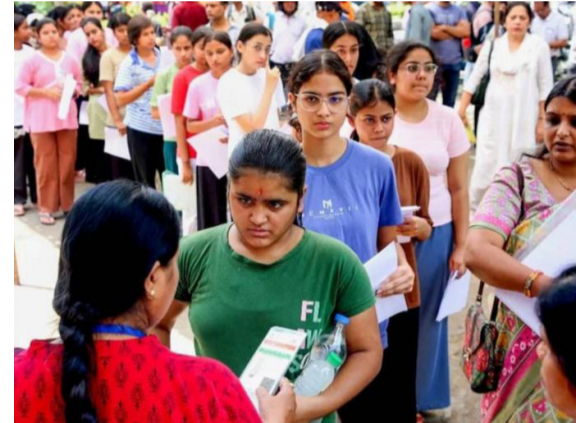
टिफ्ट्यांहून अधिक उमेदवारांना त्यांच्या पसंतीचे परीक्षा शहर देण्यात आले. अबू धाबी केंद्रासंदर्भातील वादाबाबत, एनटीएने सांगितले की त्यांच्या नोंदीनुसार परीक्षा शहरातील बदल उमेदवाराने स्वतःच्या लागिनद्वारे केला होता आणि त्याच वापरकर्त्याद्वारे सातत्याने प्रवेश केल्याचे दिसून येते. उमेदवाराच्या लागिनमधून परीक्षेचे शहर बदलले

एनटीएने सांगितले की, नोव्हेंबर २०२६ परीक्षा २१ जून रोजी पुनर्निर्धारित केल्यानंतर, उमेदवाराच्या सोयीसाठी परीक्षा-शहर दुहेरी विंडो पुन्हा उघडण्यात आली. एन-सीच्या मते, अंदाजे ३.२ लाख उमेदवारांनी या सुविचेचा लाभ घेतला आणि त्यापैकी ९९.५