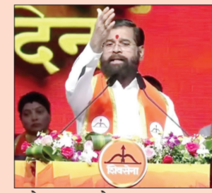
असेल तर समोर या. तुडवायला पाय लागतात, तुम्ही आला तर हे शिवसैनिक तुमचे पाय जागेवर

रात्री खासदारांना शिच्या घायच्या आणि सकाळी कौतुक करायचं, हे असं चालतं का? सेनापतीने घरात बसून चालत नाही, त्याने पुढे येऊन लढावं लागतं. हा एकनाथ शिंदे लढवण्या आहे, कुणावर संकट आलं तर पुढे मी असेन, असं एकनाथ शिंदे म्हणाले. हे काय आम्हाला चॅलेंज देणार. आता म्हणतात तुडवा. हिंमत