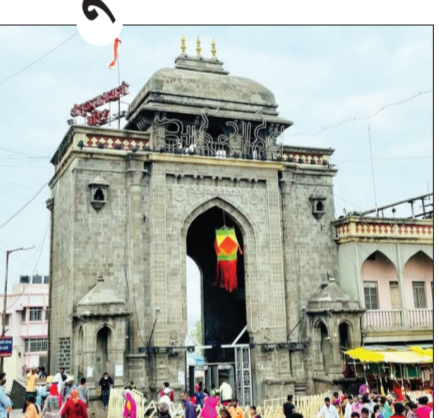
पत्र २ वर

राज्यातील लाखो भाविकांचे श्रद्धास्थान असलेल्या तुळजाभवानी मंदिर येथे दर्शन व्यवस्थेत मोठा आणि ऐतिहासिक बदल करण्यात आला आहे. मंदिर संस्थानाने व्हीआयपी आणि सर्वसामान्य भाविकांमधील भेद संपुष्टात आणत सर्वांना एकाच रांगेतून देवीचे दर्शन देण्याचा महत्त्वपूर्ण निर्णय घेतला आहे. या निर्णयामुळे मंदिरातील दर्शन व्यवस्था अधिक पारदर्शक, सुलभ आणि समान होणार असल्याचे सांगितले जात आहे. मंदिर प्रशासनाच्या नव्या नियमानुसार, यापुढे देणगीदार, व्हीआयपी