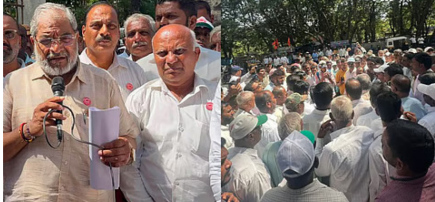
रद करावी, अशी मागणी धरणे आंदोलनावेळी करण्यात आली. शेतकऱ्यांनी पिकांना खते टाकली आहे. पण पाणी नसल्याने कडक उन्हात पिके वाळून जात आहे. वीज जोडणी तोंडली जाणार

थैथील धरणांमध्ये पाणीसाठा उपलब्ध असताना राज्य सरकार व प्रशासनाकडून चुकीचा अहवाल सादर करून उपसाबंदी आदेश लागू करण्यात आला. कोल्हापूर जिल्ह्यातील शेतकऱ्यांना पाणी दिले जात नाही, पण कर्नाटकसाठी पाणी सोडले जात असल्याचा आरोप शेट्टी यांनी केला. उपसाबंदी