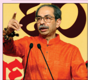
पोलिसांनी पकडल्यानंतर तो सांगतो साहेब चोरी म्हणून नका, 'ऑपरेशन

शिवसेनेचे (ठाकरे) सहा खासदार फोडून शिंदे गटात जाणार असल्याची चर्चा आहे. याला 'ऑपरेशन टायगर' असे नाव दिल्याचे बोलले जात आहे. यावर उद्धव ठाकरे यांनी सडकून टीका केली. 'ज्या पद्धतीने देशाचे राजकारण चालले आहे जनतेचा विश्वास उडत चालला आहे. सोशल मीडियावर एक मिम व्हायरल होत आहे. सोने चोराला