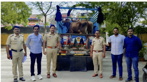
जनावरांची सुटका करून त्यांना गोशाळेमध्ये दाखल केले असून दोन आरोपीविरुद्ध पोलीस स्टेशन

माजलगाव । प्रतिनिधी येथील शहर पोलीसांनी गुप्त बातमीदारांमार्फत मिळालेल्या माहितीच्या आधारे दि. ३१ मे रविवार रोजी चांदनी ग्राउंडजवळ पय्याचे शेडमध्ये डांबून ठेवलेल्या तीन गोवंशीय जनावरांची सुटका करून त्यांना गोशाळेमध्ये दाखल केले असून एका आरोपीविरुद्ध पोलीस स्टेशन माजलगाव शहर येथे गुन्हा दाखल केला आहे. तसेच मनु रोडलगतच्या पय्याचे शेडमध्ये डांबून चार गोवंशीय