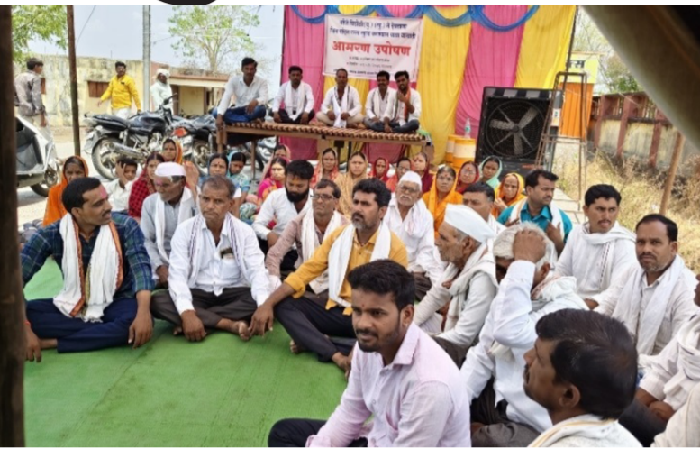
राहिले आहे आणि ते अपूर्ण राहिलेले काम गैर अर्जदार गट नं. ८, ९ विडोळी बु. मधील ४२९, ४२८, ४२७, ४२६, ४२५, ४२४, ४२३, ४२२, ४२१, ४२०, ४१९, ४१८, ४१७, ७० मधील शेतकऱ्यांनी अडविले आहे. अपूर्ण राहिलेल्या या कामासाठी अनेक वेळा पाठपुरावा करूनही प्रशासनाने रस्ता खुला करून देण्याचे आदेश काढलेले

मंठा। प्रतिनिधी मंठा तालुक्यातील विडोळी ते देवठाणा (मंठा) येथील शिव पांदण रस्त्याच्या कामात सतत अडथळा निर्माण करून शेतात जाणाऱ्या रस्त्याचे काम अडविणाऱ्या गैरअर्जदार शेतकऱ्यांविरुद्ध कारवाई करून रस्ता खुला करून द्यावा या मागणीसाठी विडोळी येथील शेतकऱ्यांनी तहसील कार्यालयासमोर सोमवार ता. १ पासून आमरण उपोषण सुरू केले आहे. विडोळी खुर्द येथील शेतकऱ्यांच्या पुर्वीपासून वडिलोपार्जित शेतजमीनी असून शिवारामध्ये जवळपास १०० ते १५० शेतकरी आहेत. त्यांना शेतात जाण्याकरिता विडोळी ते देवठाणा (मंठा) येथील शिवपांदण रस्त्याचे तत्कालीन तहसिलदार मंठा यांनी उद्घाटन करून मागील तीन-चार वर्षांपूर्वी काम सुरू केले होते.