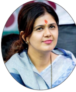
आहे. त्यांना आवडणाऱ्या सगळ्या वस्तू

अपव्यय टाळायचा आहे, त्यामुळे भव्य असे आयोजन कांही दिवस नाही केले तर योग्य होईल. मुंडे साहेबांच्या पुण्यतिथीचे आयोजन भव्य असूच असतं. खरं तर, यादिवशी आपल्या मनामध्ये तीव्र दुःख असतं पण मुंडे साहेबांची ओढ, त्यांचं प्रेम आणि आपला संकल्प हे आपल्या सर्वांची पावलं एका दिवशी करतो, त्यामुळे ते ही सर्वांनी मुंडे साहेबांची पुण्यतिथी आपापल्या गावात, घरात, शहरात, वाड्यात, आपण जिथे असाल तिथे करावी जेणे करून पंतप्रधान मोदींच्या आवाहनाला सकारात्मक प्रतिसाद देता येईल. एका बांधवाने मला बैलगाडीचा उपाय सुचवला होता पण एवढ्या भर उन्हात पशुनाही त्याचा