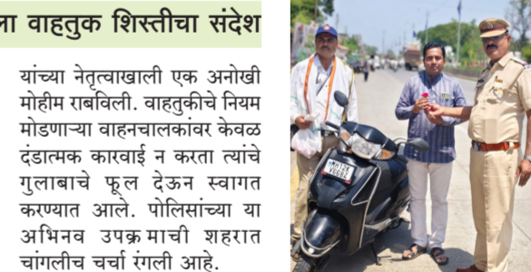
यांच्या नेतृत्वाखाली एक अनोखी मोहीम राबविली. वाहतुकीचे नियम मोडणाऱ्या वाहनचालकांवर केवळ दंडात्मक कारवाई न करता त्यांचे गुलाबाचे फूल देऊन स्वागत करण्यात आले. पोलीसांच्या या अभिनव उपक्रमाची शहरात चांगलीच चर्चा रंगली आहे. या मोहिमेदरम्यान चुकीच्या दिशेने वाहन चालविणे, कागदपत्रे जवळ नसणे, इन्शुरन्स नसणे, पीयूसी नसणे, लायसन्स नसणे तसेच इतर वाहतुक नियमांचे उल्लंघन करणाऱ्या वाहनचालकांना थांबवून त्यांना गुलाबाचे फूल