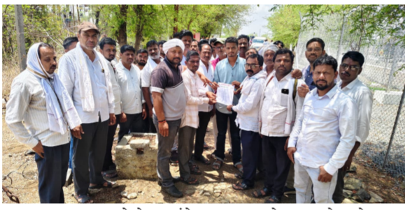
करण्यात असून त्यामुळे शेतकऱ्यांचे अतोनात नुकसान होत आहे. पाणी असून पण शेतकऱ्यांना ऊस, फळबागासाठी पाणी देणे

युसूफवडगांव । प्रतिनिधी कृषी तालुक्यातील युसूफवडगांव परिसरात गेल्या काही दिवसांपासून शेतीसाठी अत्यंत कमी वेळ लाईट ठेवण्यात येत असल्यामुळे शेतकरी अडचणी आहेत त्यामुळे कृषीपंपासाठी आठ तास लाईट द्यावी अशी मागणी युसूफवडगांव परिसरातील शेतकऱ्यांनी केली आहे. गत काही दिवसांपासून युसूफवडगांव परिसरातील शेतकऱ्यांना शेतीसाठी अत्यंत कमी कालावधीसाठी वीज पुवट्टा