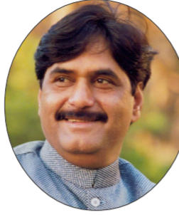
गोपीनाथगडाकडे घेवून जातात. सर्वांना परत

जगावरील सध्याचे संकट पाहता मुंडे साहेबांची पुण्यतिथी आपापल्या गावात, घरीच करावी असे आवाहन केले आहे. यात त्या म्हणाल्या, मी सर्वाना आवाहन केले होते, पंतप्रधान नरेंद्र मोदी यांनीही केले होते. आज जगावर, आपल्या देशावर जे संकट ओढवले आहे, त्यावर उपाय म्हणून आपल्याला काही सावधानता बाळगायच्या आहेत. इधनाचा