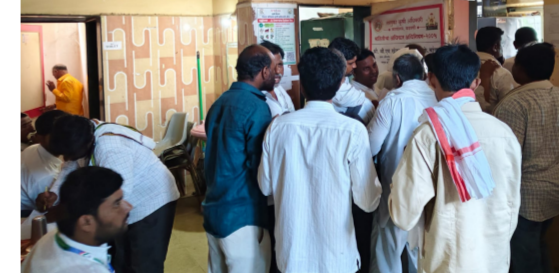
दुकानावर रांगेत उभा राहावे लागले यामध्ये मोठ्या प्रमाणात गर्दी झाली होती.

तालुका कृषी अधिकारी कार्यालयाचे दिसाळ नियोजन वडवणी | प्रतिनिधी शेतकऱ्यांना शासनाने कृषी कार्यालयामार्फत महाडीबीटी पोर्टलवर ऑनलाईन केलेल्या शेतकऱ्यांना प्रथम प्राधान्य यादीनुसार ७५ किलो प्रति हेक्टर मोफत सोयाबीन बियाणे देण्यासाठी काल तालुका कृषी अधिकारी कार्यालयात शेतकऱ्यांनी गर्दी करून रांगा लावून कागदपत्रे जमा करून टोकन घेतले परत शेतकऱ्यांना बियाणे घेण्यासाठी कृषी