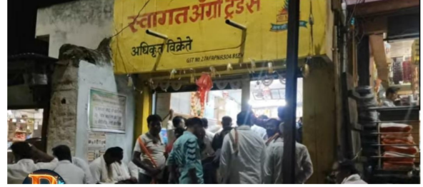
केवळ चार विक्रेत्यांमुळे गैरसोय; कृषी विभागाने तातडीने हस्तक्षेप करण्याची मागणी

पाटोदा । प्रतिनिधी महाडीबीटी पोर्टलमार्फत बियाणे निवडीचे संदेश प्राप्त झाल्यानंतर पाटोदा तालुक्यातील शेतकरी मोठ्या प्रमाणावर बियाणे घेण्यासाठी केंद्रावर दाखल होत आहेत. मात्र तालुक्यात बियाणे पुरवठ्यासाठी केवळ चारच दुकानदारांची निवड करण्यात आल्याने शेतकऱ्यांना प्रचंड गैरसोयीचा सामना करावा लागत आहे.