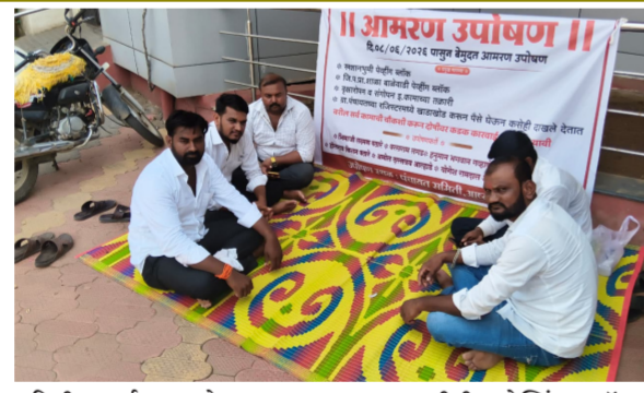
समिती कार्यालयासमोर आमरण उपोषण सुरू केले आहे.

बाळेवाडीत झालेल्या बोगस कामांच्या चौकशीसाठी ग्रामस्थांचे आमरण उपोषण आष्टी | प्रतिनिधी शासनाकडून गावाच्या विकासासाठी लाहो रूपांच्या निधी येतो, मात्र हा निधी गावच्या विकासासाठी नव्हे तर धनदांडग्यांच्या आणि धर अधिकाऱ्यांच्या खाशासाठीच वापरला जात असल्याचा प्रकार आष्टी तालुक्यातील बाळेवाडी येथे उघडकीस आला आहे. स्मशानभूमी व जिल्हा परिषद शाळेतील पेव्हिंग ब्लॉक आणि वृक्षारोपण योजनेतील बोगस कामांची सखोल चौकशी व्हावी या मागणीसाठी बाळेवाडी येथील ग्रामस्थांनी सोमवार दि. ८ जून २०२६ पासून आष्टी पंचायत