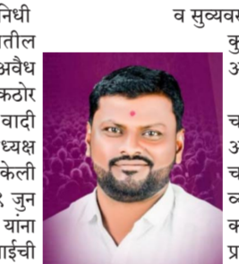
वडवणीत अवैध मटका-जुगाराला उत; कारवाईची राष्ट्रवादी काँग्रेसची मागणी