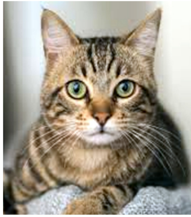
केली; मांजरीने आंगठी गिळल्याचे समजताच घरातील पुरुषांनी तातडीने त्या मांजराला पकडून एका जागी बांधून ठेवले. जावईबापूनाही

एका पिटाच्या धोंड्यात (खाद्यपदार्थ) लपवून ठेवली होती. घरात जावईबापूचे स्वागत आणि पाहणचार मोठ्या थाटापासून सुरू होता. सर्वजण आनंदात मग्न असतानाच, घरातील मांजरीने तो पिटाचा धोंडा अन्न समजून फस्त केला. धोंड्यासोबतच त्यातील ५ ग्रॅम सोन्याची अंगठीही माजराच्या पोटात गेली. हा प्रकार काही वेळातच कुटुंबाच्या लक्षात आला आणि आनंदाच्या वातावरणात अचानक चिंतेच सावट पसरली. जावयाचे कपडे देऊन बोळवण