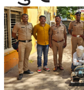
कारवाईमुळे पोलीसांचे कौतुक होत आहे. बांधकामाच्या ठिकाणी झाली होती चोरी

बीड । प्रतिनिधी बीड शहरातील शाहनगर भागात बांधकाम सुरू असलेल्या ठिकाणी झालेल्या घरफोडीचा गुन्हा शिवाजीनगर पोलीसांनी अत्यंत तत्परतेने उघडकीस आणला आहे. गुन्हा दाखल झाल्यानंतर अवघ्या दोन तासांच्या आत पोलीसांनी आरोपीला बेड्या टोकल्या असून, चोरीस गेलेला सर्व मुद्देमाल हस्तगत करण्यात यश मिळवले आहे. या धडाकेबाज