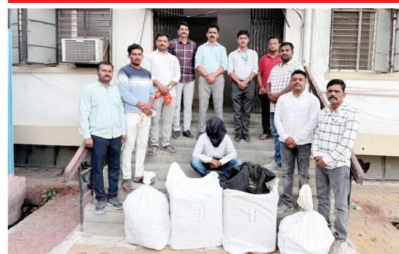
अवैध गुटखा वाहतुक करीत असतांना मिळून आला. त्याच्या ताब्यातून गुटखा व स्वीट कार

मोजे पोहेनेर गावात एक इसम त्याच्या ताब्यातील अॅटोरिक्षामध्ये गुटखा भरून त्याची विक्री करण्यासाठी घेवून जात असतांना मिळून आला. त्याच्या ताब्यातून ५,४२,८००/- रूपयाचा गुटखा व टेम्पो जप्त करण्यात आला आहे. वरील तिन्ही ठिकाणी १२,१३,८००/- रूपयाचा गुटखाचा मुद्देमाल व वाहन जप्त करून संबधीत पोस्टेला गुन्हे दाखल करण्यात आलेले आहेत.