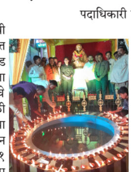
पदाधिकारी व सदस्य उपस्थित होते. यावेळी बीड शहरातील विविध समाज बांधवांनी आपल्या कुटुंबियांसह मोठ्या संख्येने सहभाग नोंदविला. दीपप्रज्वलनाच्या प्रकाशाने परिसर उजळून निघाला असून संपूर्ण कार्यक्रम उत्साहपूर्ण, भक्तिमय व आनंददायी वातावरणात पार पडला. राजमाता अहिल्यादेवी होळकर यांच्या लोककल्याणकारी, न्यायप्रिय आणि आदर्श शासन व्यवस्थेच्या कार्याचा गौरव करत उपस्थित मान्यवरांनी त्यांच्या विचारांचा वारसा पुढील पिढीपर्यंत पोहोचविण्याचे आवाहन केले. जयंतीनिमित्त आयोजित करण्यात आलेल्या या दीपोत्सवाने बीड शहरात एक वेगळे प्रेरणादायी वातावरण निर्माण झाले.