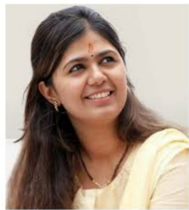
पशुसंवर्धन मंत्री ना. पंकजाताई मुंडे यांनी जिल्हा पोलीस अधीक्षकांना दिले

बीड । प्रतिनिधी माजलगाव येथे बकरी ईदच्या दिवशी सुमारे चारशेहून अधिक गोवंशाची निर्दयी आणि अमानुषपणे हत्या करण्यात आल्याचा प्रकार उघडकीस आला आहे. हा प्रकार अत्यंत संतापजनक असून प्रकरणाचा तातडीने तपास करून दोषींवर कडक कारवाई करावी असे निर्देश राज्याच्या पर्यावरण व