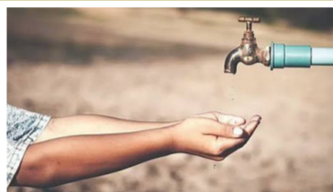
अधिकारी यांच्याकडे कारवाईची मागणी करण्यात येणार असल्याचे गाढेवाडी ग्रामस्थांनी सांगितले आहे. खडकी-कोळगाव येथील तलावात जलजीवन मिशन योजनेद्वारे विहीरीचे काम झालेले आहे. दरम्यान येथून

गेवराई । प्रतिनिधी जलजीवन मिशन अंतर्गत गाढेवाडी ग्रामस्थांसाठी पुर्वदा करण्यात येणाऱ्या पाणीपुरवठा योजनेच्या मुख्य पाईपलाईनला अनधिकृत कनेक्शन घेऊन मोठ्या प्रमाणात पाणी चोरी होत असल्याचा गंभीर प्रकार समोर आला आहे. या पाणी चोरीमुळे गावात सध्या ग्रामस्थांनी पिंपण पाणी टंचाईचा सामना करावा लागत आहे. याबाबत ग्रामपंचायत प्रशासनाला माहिती देवूनही कारवाई होत नसल्याने ग्रामस्थांमधून तीव्र संताप व्यक्त होत आहे. याप्रकरणी तहसीलदार तसेच गविकास