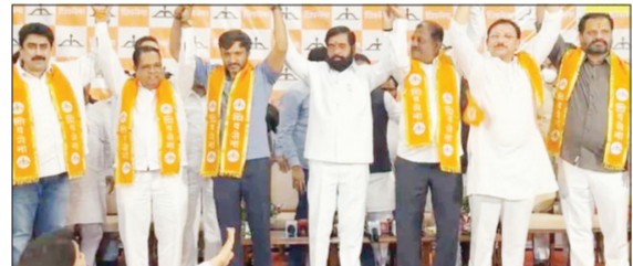
मुंबई । प्रतिनिधी

शिवसेना ठाकरे गटाच्या बंडखोर खासदारांनी केली पक्षांतराची घोषणा