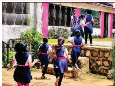
बीड । प्रतिनिधी

जिल्ह्यात अल निनोचा प्रभाव आणि लांबलेल्या पावसामुळे तापमानात मोठी वाढ झाली आहे. वाढत्या उष्णतेमुळे विद्यार्थ्यांच्या आरोग्यावर होणारा विपरीत परिणाम आणि उष्णताचा धोका लक्षात घेता, जिल्हा परिषदेच्या शिक्षण विभागाने शाळांच्या वेळेत बदल करण्याचा निर्णय घेतला आहे. जिल्हा परिषदेच्या शिक्षण विभागाने सोमवारी (२२ जून) यासंदर्भात अधिकृत आदेश जारी केला आहे. त्यानुसार, मंगळवार, २३ जून २०२६ पासून पुढील आदेशापर्यंत जिल्ह्यातील सर्व शाळा सकाळच्या सत्रात भरवण्यात येणार आहेत. शाळांची नवीन वेळ सकाळी ८:०० ते दुपारी १२:३० अशी निश्चित करण्यात आली आहे. वाढत्या ▶▶ पान २ वर