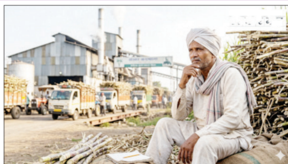
ऊस तोडणीच्या वेळी शेतकऱ्यांना लवकरात लवकर पैसे देण्याचे आश्वासन देणारे कारखानदार हंगाम संपल्यानंतर

राज्यातील २०२५-२६ चा साखर हंगाम संपून जवळपास चार महिन्यांचा कालावधी उलटून गेला असला तरी हजारो ऊस उत्पादक शेतकऱ्यांना अद्याप त्यांच्या घामाच्या मोबदल्याची प्रतीक्षा करावी लागत आहे. साखर कारखान्यांकडे शेतकऱ्यांच्या उसाची एफआरपी थकीत असून, राज्यभरातील ५६ साखर कारखान्यांकडे तब्बल ३९६ कोटी रुपये अडकले आहेत. यामध्ये सोलापूर जिल्ह्यातील आठ साखर कारखान्यांकडेच ८८ कोटी रुपयांहून अधिक रक्कम थकीत असल्याने ऊस उत्पादकांमध्ये तीव्र नाराजी व्यक्त होत आहे.