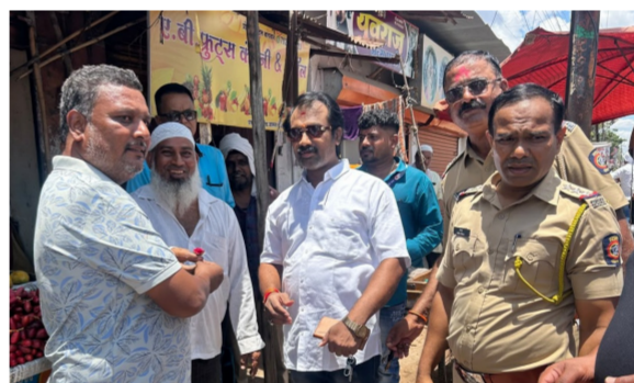
कायदेशीर कारवाई करण्यात येईल, असा स्पष्ट इशारा वाहतूक शाखेने दिला आहे. जिल्हा वाहतूक शाखेचे

बीड । प्रतिनिधी बीड शहरातील वाहतूकीस अडथळा ठरणाऱ्या अतिक्रमणांविरोधात जिल्हा वाहतूक शाखेने पुन्हा एकदा जनजागृतीचा मार्ग अवलंबत अतिक्रमणधारकांना फूल देऊन अतिक्रमण करू नका, अशी समज दिली. मात्र, यानंतरही नियमांचे उल्लंघन करून रस्ते, नाले, फूटपाथ अथवा सार्वजनिक जागांवर अतिक्रमण केल्यास कोणतीही दया न दाखवता कठोर