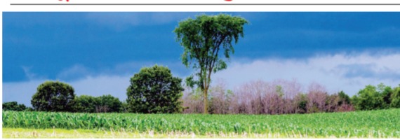
पुणे । प्रतिनिधी

मान्सून सक्रिय, अरबी समुद्रातील वारे बळकट