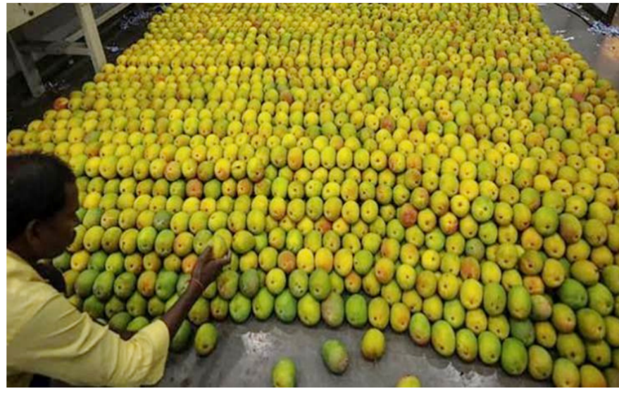
ओमानसह जवळपास २० देशांमध्ये आंबाविषयक प्रचार-प्रसार कार्यक्रम आयोजित करण्यात आले

अमेरिका हा जगातील सर्वांत मोठा आंबा आयातदार देश मानला जातो. यंदाच्या हंगामाचा शेवट होण्यास जवळपास एक महिना बाकी असतानाच भारतीय आंब्याची निर्यात गेल्या वर्षाच्या एकूण निर्यातीपेक्षा जास्त झाली आहे. त्यामुळे निर्यातीत लक्षणीय वाढ अपेक्षित आहे. निर्यात वाढीला चालना देण्यासाठी 'अपेडा'ने अमेरिकेतील सिपटल, लॉस एंजेलिस, वॉशिंग्टन, न्यू यॉर्क आणि अटलांटा या प्रमुख शहरांमध्ये आंबा प्रचार मोहीम राबविली आहे. याशिवाय ब्रेक प्रजासत्ताक, मलेशिया, स्पेन, संयुक्त अरब अमिराती आणि