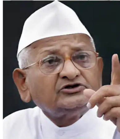
त्वरित रद्द न केल्यास ५ जुलै २०२६ पासून राळेगणसिद्धी येथील यादवबाबा मंदिरात

अहिल्यानगर। प्रतिनिधी माहितीचा अधिकार हा शासनाने जनतेवर केलेला उपकार नसून तो नागरिकांचा घटनात्मक अधिकार आहे. मात्र, राज्य सरकारने १२ जून २०२६ रोजी प्रसिद्ध केलेले 'महाराष्ट्र माहितीचा अधिकार नियम, २०२६' हे या कायद्याची धार बोधट करणारे आणि भ्रष्टाचाराला ढाल देणारे आहेत. प्रशासनातील ही हुकूमशाही मोडून काढण्यासाठी आणि माहितीचा अधिकार वाचवण्यासाठी मी माझ्या प्राणाची आहूती देण्यासही मागे हटणार नाही," असा थेट आणि निर्वाणीचा इशारा ज्येष्ठ समाजसेवक अण्णा हजारें यांनी राज्य सरकारला दिला आहे. या संदर्भात अण्णा हजारें यांनी मुख्यमंत्री देवेंद्र फडणवीस यांना एक सविस्तर आणि कडक पत्र पाठवले असून, १२ जूनच्या बेकायदेशीर दुस्त्या