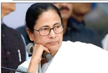
कोलकाता । वृत्तसंस्था