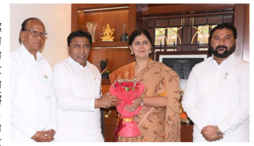
मुंबई । प्रतिनिधी स्थानिक स्वराज्य संस्था विधानपरिषद निवडणुकीत भाजपा महायुतीची सरशी झाली असून १७ पैकी १६ जागांवर महायुतीने घवघवीत यश संपादन केले आहे. आजच्या मतमोजणीनंतर विजयी झालेल्या सर्व नवनिर्वाचित आमदारांचे राज्याच्या पर्यटन व पर्यटनवर्धन मंत्री ना. पंकजाताई मुंडे यांनी अभिनंदन करून शुभेच्छा दिल्या आहेत. विधानपरिषदेच्या निवडणुकीच्या अकरा जागांची मतमोजणी आज झाली, यात दहा जागांवर भाजपा महायुतीचे आमदार मोठ्या मताधिक्याने विजयी झाले, एकूण १७ जागांपैकी यापूर्वी महायुतीच्या ६ जागा विरोध निवडून आल्या होत्या, त्यामुळे आजच्या मतमोजणीनंतर महायुतीचे १६ आमदार विजयी झाले असून विरोधी आघाडीला एकही जागा मिळाली नाही.

स्थानिक स्वराज्य संस्था विधानपरिषद निवडणुकीत भाजपा महायुतीची सरशी झाली असून १७ पैकी १६ जागांवर महायुतीने घवघवीत यश संपादन केले आहे. आजच्या मतमोजणीनंतर विजयी झालेल्या सर्व नवनिर्वाचित आमदारांचे राज्याच्या पर्यटन व पर्यटनवर्धन मंत्री ना. पंकजाताई मुंडे यांनी अभिनंदन करून शुभेच्छा दिल्या आहेत. विधानपरिषदेच्या निवडणुकीच्या अकरा जागांची मतमोजणी आज झाली, यात दहा जागांवर भाजपा महायुतीचे आमदार मोठ्या मताधिक्याने विजयी झाले, एकूण १७ जागांपैकी यापूर्वी महायुतीच्या ६ जागा विरोध निवडून आल्या होत्या, त्यामुळे आजच्या मतमोजणीनंतर महायुतीचे १६ आमदार विजयी झाले असून विरोधी आघाडीला एकही जागा मिळाली नाही.