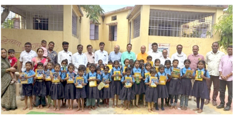
इंटरनेशनल ही संस्था संपूर्ण देशात विदेशात मानवीय सेवेच्या रुपाने मागील ५० वर्षा