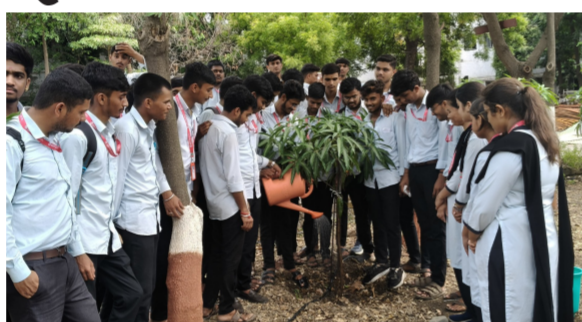
प्रत्येकाने किमान एक झाड लावून ते जगवायचेच', विद्यार्थ्यांनी घेतली सामूहिक शपथ

बीड । प्रतिनिधी जागतिक पर्यावरण दिनाचे औचित्य साधून आदित्य शिक्षण संस्था संचलित आदित्य कृषी महाविद्यालयात वृक्षारोपण आणि वृक्षसंवर्धन अभियान मोठ्या उत्साहात पार पडले. केवळ नवीन झाडे लावण्यापुरते मर्यादित न राहता, महाविद्यालय परिसरातील जुन्या वृक्षांचे संमोहन व संरक्षण करण्याचा एक स्तुत्य उपक्रम राबविण्यात आला. या सौतब प्रत्येकाने किमान एक झाड