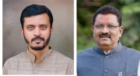
तालुक्यातील सांगवी आष्टी, खडकत, शितपुर, नागलवाडी, देवी गव्हाण तलाव परिसर टाकळशिंग, या ठिकाणाहून मोठ्या प्रमाणात अवैधरित्या वाळू उपसा होत आहे तहसील प्रशासन