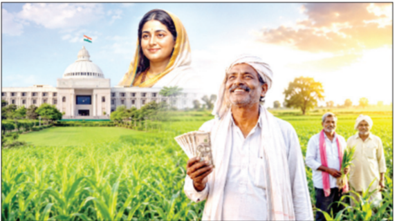
सहकार, पणन विभागाने केला असून, मुख्य सचिवांच्या याबाबत शासन निर्णय जारी करण्यात आला आहे.