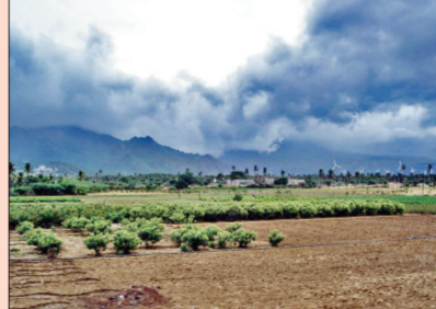
धुळे, जळगाव, नाशिक आणि सोलापूर जिल्ह्यात काही भागात उष्णतेच्या लाटेसह पावसाची शक्यता आहे. तर पुणे जिल्ह्यात तुरळक ठिकाणी विजा, वादळी वाऱ्यांसह हलका ते मध्यम पाऊस हजेरी लावण्याची शक्यता असून सांगली, सातारा कोल्हापूर जिल्ह्यात हलक्या सर्रांचा अंदाज हवामान विभागाने वर्तवला आहे. पान २ वर

पुणे। प्रतिनिधी नैऋत्य मोसमी वारे अर्थात मॉन्सूनच्या आगमनाची प्रतिक्षा शेतकरी करत आहेत. परंतु मॉन्सूनचा प्रवास ठप्प असून, मॉन्सून पोहचलेल्या भागातही पाऊस गायब आहे. त्यामुळे उन्हाच्या चटक्यासह उकाड्यात वाढ झाली असून काही भागात पावसाचा अंदाज आहे. कोकणात उन्हाचा चटका आणि दमट हवामानाची शक्यता असून मध्य महाराष्ट्र आणि मराठवाड्यात उन्हाचा ताप वाढणार आहे. तर विदर्भात काही जिल्ह्यात वादळी पावसाचा इशारा हवामानशास्त्र विभागाने दिला आहे. कोकणातील पालघर, ठाणे, मुंबई, रायगड आणि रत्नागिरी जिल्ह्यात उष्ण व दमट हवामानासह तुरळक ठिकाणी हलक्या पावसाची शक्यता आहे. तर मध्य महाराष्ट्रातील नंदुरबार,