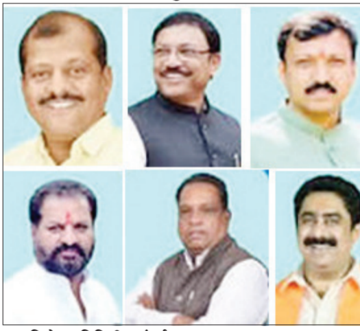
विशेष प्रतिनिधी। मुंबई