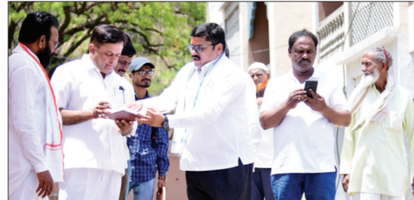
विकासाकामे हाती घेण्यात आली आहेत. मात्र, विविध कारणांमुळे