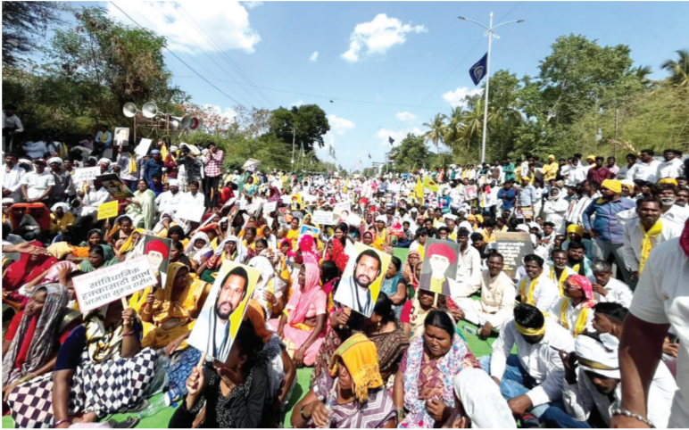
साठे चौक पुतळा, जालना रोड, बस स्थानक रोड परिसर, छत्रपती शिवाजी महाराज चौक

बीड शहरामध्ये मंगळवारी दुपारी सिद्धिविनायक व्यापारी संकुल स्टेडियम येथून मातंग क्रांती मोर्चा प्रारंभ झाला. शहरातील प्रमुख मार्गावरून हा मोर्चा सुभाष रोड, अण्णाभाऊ