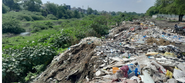
घेतलेली नसल्यामुळे नियमबाह्य बांधकामांना अप्रत्यक्षपणे प्रोत्साहन मिळाल्याची भावना नागरिकांमध्ये निर्माण झाली आहे. निवेदनात पुढे म्हटले आहे की, नदी

परवानग्या देताना लागू असलेले कायदे, विकास नियंत्रण नियम, पूररेषा निर्बंध, जलसंपदा विभागाची आवश्यक मंजूरी तसेच इतर विभागीय परवानग्यांचे पालन करण्यात आले आहे किंवा नाही, याबाबत गंभीर शंका निर्माण झालेली आहे. सामाजिक कार्यकर्त्यांनी असा आरोप केला आहे की, बिंदुसरा नदी पात्र, पूरप्रवण क्षेत्र तसेच रेड फ्लड लाईन व ब्ल्यू फ्लड लाईन परिसरातील बांधकामांबाबत गेल्या अनेक वर्षांपासून नागरिक, सामाजिक संघटना व विविध सामाजिक चळवळींकडून सातत्याने आंदोलने, निवेदने, तक्रारी व पाठपुरावा करण्यात आलेला आहे. मात्र या गंभीर बाबींची अपेक्षित दखल संबंधित प्रशासनाने