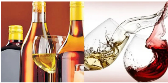
केला जात आहे.

मावळ : फुगेवाडी येथे विषारी गावठी दारू प्रकरणात अनेकांचा मृत्यू झाल्यानंतर राज्यभरात खळबळ उडाली असताना मावळ तालुक्यातील अवैध हातभट्टी दारू विक्रीचा प्रश्न पुन्हा ऐरणीवर आला आहे. पोलिस आणि राज्य उत्पादन शुल्क विभागाकडून वारंवार कारवाया होऊनही तालुक्यातील अनेक भागांत गावठी दारूची विक्री राजरोसपणे सुरू असल्याने नागरिकांमध्ये तीव्र नाराजी व्यक्त होत आहे. भविष्यात मावळातही फुगेवाडीसारखी दुर्घटना घडल्यास त्याला जबाबदार कोण, असा सवाल नागरिकांकडून उपस्थित