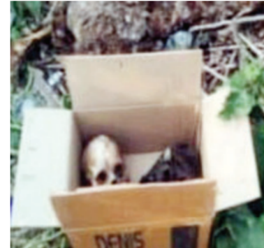
पसताच घटनास्थळी नागरिकांची मोठी गर्दी झाली. घटनेची माहिती मिळताच माजलगाव ग्रामीण पोलिस ठाण्याचे अधिकारी तात्काळ

माजलगाव। प्रतिनिधी तालुक्यातील डुब्बा मांजरा गावालागत वाहणाऱ्या सिंदफणा नदीच्या पात्रात एका महिलेचा सांगाडा आढळून आल्याची धक्कादायक घटना दि. २३ मे शनिवार रोजी उघडकीस आली आहे. या घटनेमुळे परिसरात मोठी खळबळ उडाली असून नागरिकांमध्ये भीतीचे वातावरण निर्माण झाले आहे. मिळालेल्या माहितीनुसार, गावातील काही नागरिक नदीकाठी सरपण गोळा करण्यासाठी गेले असता त्यांना झाडाडुड्यांमध्ये मानवी सांगाड्यासारखी वस्तू दिसून आली. संशय आल्याने त्यांनी जवळ जाऊन पाहिले असता तो मानवी सांगाडा असल्याचे स्पष्ट झाले. ही माहिती गावात