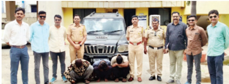
गाडीचा माग काढत तब्बल १९० किलोमीटर अंतरावरिल टोल नाके आणि रस्त्यावरील सीसीटीव्ही कॅमेरे तपासले. तपासात धक्कादायक बाब समोर आली की, आरोपींनी पोलिसांना गुंगारा देण्यासाठी प्रवासादरम्यान वारंवार गाडीच्या नंबर प्लेट बदलल्या होत्या. अखेर तांत्रिक आणि गोपनीय माहितीच्या आधारे ही गाडी मालेगावच्या दिशेने गेल्याचे समजताच पोलिसांचे पथक तातडीने मालेगावकडे रवाना झाले.

बीड। प्रतिनिधी बीड शहरातील नागोबा गल्ली भागातून स्कॉर्पिओ गाड्यामधून गोवंश जातीची जनावरे चोरी करणाऱ्या एका सराईत आणि अडदल चोरांच्या टोळीला पेट बीड पोलिसांनी अत्यंत शिताफीने अटक केली आहे. पोलिसांनी या कारवाईत तीन आरोपींना जेरबंद केले असून, यांनी तातडीने तपास पथक (डी.बी. पथक) नियुक्त करून आरोपींच्या शोधासाठी रवाना केले. तपास पथकाने बीड शहरातील तब्बल ४० पेक्षा अधिक सीसीटीव्ही कॅमेरे तपासले. यामध्ये एक संशयित काळ्या रंगाची स्कॉर्पिओ गाडी दिसून आली, मात्र तिचा क्रमांक स्पष्ट दिसत नव्हता.