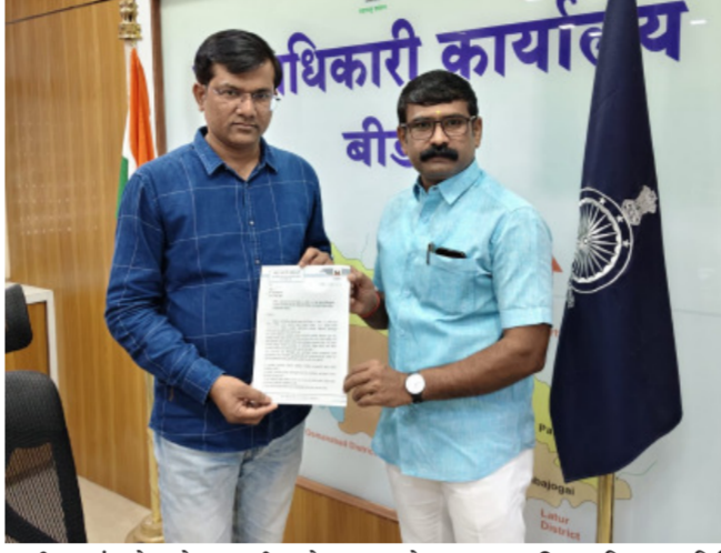
आदी भागांमध्ये अनेक नागरिक गेल्या अनेक वर्षांपासून वास्तव्यास असल्याचे नमूद करण्यात आले आहे. मात्र संबंधित जागांची अधिकृत मालकी नसल्यामुळे या नागरिकांना घरकुल योजना, शासकीय सुविधा व विविध विकास योजनांचा लाभ घेण्यात मोठ्या अडचणीचा सामना करावा लागत आहे. राज्य शासनाच्या नव्या निर्णयामुळे अशा नागरिकांना त्यांच्या वास्तव्यास