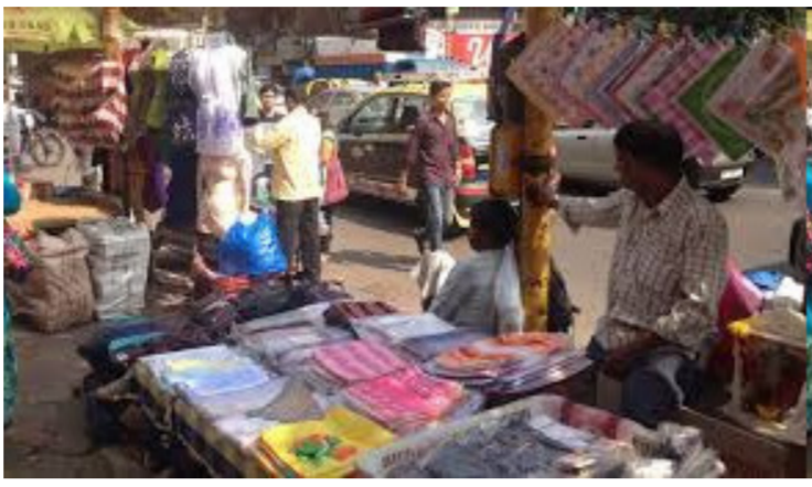
परवानाधारकांचे प्रमाणीकरण करण्यासाठी महापालिकेने नूतनीकरण प्रक्रिया अनिवार्य केली आहे. जाणीव हातगाडी फेरी पथारी स्टॉलधारक संघटनेने केलेल्या मागणीनंतर अतिक्रमण निर्मूलन विभागाचे नूतनीकरणार्थी

पुणे प्रतिनिधी महापालिका क्षेत्रातील पथ विक्रेत्यांसाठी प्रशासनाचे कडक पवित्रा घेतला असून, फेरीवाला प्रमाणपत्र नूतनीकरणसाठी आता ३१ मेपर्यंतची अंतिम मुदत दिली आहे. विशेष म्हणजे, २०१८ पासून तब्बल १८५० हॉकरांनी २० कोटी ५ लाख रुपये थकवल्याचे समोर आले आहे. या थकबाकीदारांसह नूतनीकरण न करणाऱ्यांवर आता परवाना रद्द करण्याची टांगती तलवार आहे. शहरातील १५ क्षेत्रीय कार्यालयांतर्गत १ हजार ८५० फेरीवाल्यांनी गेल्या आठ वर्षांपासून परवाना शुल्क भरलेले नाही. यामध्ये सिंगड रोड क्षेत्रीय कार्यालयांतर्गत सर्वाधिक ३५ कोटींची थकबाकी असून, त्याखालोखाल कसबा-विश्रामबागवाडा ३६ कोटी आणि धनकवडी-सहकारनगर विभागका क्रमांक लागतो. ही अबाढव्य थकबाकी वसूल करण्यासाठी आणि