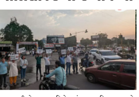
या समस्येवर कायमस्वरूपी तोडगा काढण्यासाठी नागरिकांनी या मोहिमेचे आयोजन केले होते. 'नो पार्किंग' क्षेत्राची आवश्यकता: रस्त्याच्या एका बाजूला अस्ताव्यस्त होणाऱ्या पार्किंगमुळे रस्ता अरंद होत असून, या ठिकाणी अधिकृतपणे 'नो पार्किंग' क्षेत्र घोषित करण्याची मागणी करण्यात आली आहे. अतिक्रमण निर्मूलन: पादचारी मार्ग आणि रस्त्यांवरील अनधिकृत

पुणे । प्रतिनिधी पाषाणमधील बालाजी मंदिर गल्ली आणि बालाजी चौक परिसरातील रहिवाशांनी व्हाईस ऑफ पाषाण (तेल्लेशेण झरीहप) या अभियानांतर्गत रविवारी, १० मे २०२६ रोजी व्यापक वाहतूक जनजागृती मोहीम राबवली. वाहतूक पोलीस विभागाच्या सहकार्याने आयोजित या मोहिमेद्वारे परिसरातील वाढत्या वाहतूक कोंडीकडे लक्ष वेधण्यात आले. बालाजी मंदिर गल्ली हा परिसर १५ पेक्षा जास्त मोठ्या गृहनिर्माण सोसायट्यांसाठी बाहेर पडण्याचा एकमेव मार्ग असून, दररोज २,००० हून अधिक वाहने या मार्गाचा वापर करतात. या एकाच अरंद मार्गावर अवलंबून असलेल्या वाहनसंख्येमुळे येथे दररोज मोठी वाहतूक कोंडी निर्माण होत आहे.