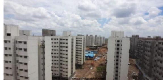
ज्यांना भोववटा प्रमाणपत्र दिले त्या प्रकल्पातील पालिकेला देय असलेल्या जागांची माहिती मुदतीत द्यावयाची आहे. त्यानुसार एआर प्रकल्पांची छाननी करून कोणत्या प्रकल्पातील जागा पालिकेकडे आल्या नाहीत, याचा अहवाल द्यावयाचा आहे. अशा जागांचा तातडीने ताबा घेण्याची कार्यवाही सुरू करण्याचे निर्देश दिले आहेत. समावेशक

जागांचा वापर सध्या अनेक ठिकाणी विकसक करत आहे. त्याबाबत तक्रारी आलेल्या असतानाही बांधकाम विभागाने जागा ताब्यात घेतलेल्या नाहीत. त्यामुळे विकसक त्यांचा व्यावसायिक वापर करत त्यातूनही उत्पन्न मिळवत आहेत. दुसरीकडे एवढ्या महत्वाच्या बाबीची माहिती बांधकाम विभागाकडे का नाही, असा सवालही उपस्थित होत आहे. शहर विकास आराखड्यात (डीपी) सार्वजनिक सुविधा, शाळा, रुग्णालय, उद्यान, कार्यालये किंवा इतर नागरी सुविधांसाठी आरक्षित जागांवर अकॉमोडेशन रिझर्वेशन ही तत्पुढे लागू होते. ही समावेशक किंवा समावेशन आरक्षण म्हणून ओळखली जाते. आरक्षण ही संकल्पना शहरातील सार्वजनिक सुविधा वेगाने उपलब्ध होण्यासाठी महत्त्वाची आहे. जमीन संपादनासाठी होणारा मोठा खर्च आणि वेळ टाळण्यासाठी याचा वापर केला जातो. मंजूर प्रकल्पातील जागांचा ताबा वेळेत न मिळाल्यास पालिकेच्या सुविधा प्रकल्पांवर परिणाम होत असतो. पालिकेस मिळणारे गाळे, सदनिका, व्यावसायिक