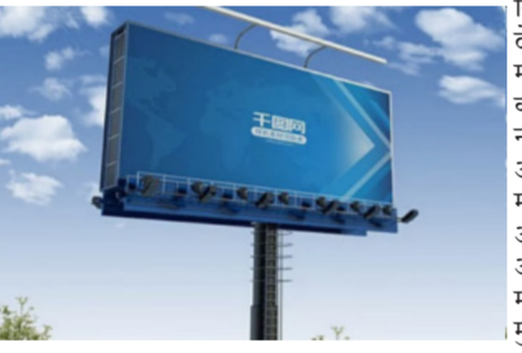
रुपये निश्चित करण्यात आल्याचे स्पष्ट केले होते. गेल्या वर्षी डिसेंबरमध्ये उच्च न्यायालयाने महापालिकेच्या बाजूने निकाल दिला. त्याचिरीत धात व्यावसायिकांनी सर्वोच्च न्यायालयात याचिका दाखल केली होती.

न्यायालयात धाव घेतली होती. महापालिकेने न्यायालयात प्रतिघात सादर करताना, २०१३ मध्ये निश्चित करण्यात आलेला २२२ रुपयांचा दर आणि दरवर्षी १० टक्के वाढीच्या सूत्रानुसार २०२३ मध्ये भाडेदर ५८०