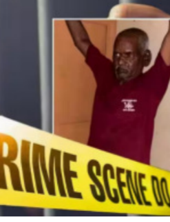
आणखी दोन दिवसांची पोलीस कोठडी सुनावण्यात आली आहे. नसरापूर घटनेतील आरोपीला १४ मे पर्यंत पोलीस कोठडी सुनावली आहे.