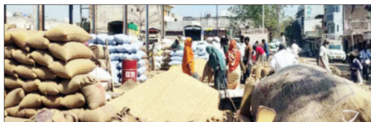
चवहजार होत आहेत. काही ठिकाणी ५,००० ते ५,५०० रुपये दरम्यानही खरेदी-विक्री सुरू आहे.

सध्या बाजारात सोयाबीनच्या दरात लक्षणीय वाढ होत असली तरी या दरवाढीचा प्रत्यक्ष लाभ शेतकऱ्यांपर्यंत पोहोचत नसल्याचे चित्र स्पष्ट होत आहे. उलटपक्षी, साठवणुकदार व व्यापाऱ्यांनी कमी दरात खरेदी करून ठेवलेल्या मालामुळे त्यांनाच या तेजीचा सर्वाधिक फायदा होत असल्याची वस्तुस्थिती समोर येत आहे. कृषी उत्पन्न बाजार समित्यांमध्ये सध्या सोयाबीनचे दर हमीभावाच्या पुढे गेले असून प्रति क्ठिल ५,७०० रुपयांपर्यंत