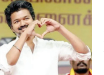
पक्षाने १०८ जागांवर विजय मिळवून दणदणीत कामगिरी केली आहे. विशेष म्हणजे, विजय स्वतः दोन मतदारसंघांतून निवडून आले आहेत. नियमानुसार त्यांना एका जागेचा राजीनामा द्यावा लागणार असल्याने त्यांच्या पक्षाचे संख्याबळ १०७ होईल. एकूण आमदारांची संख्या २३३ गृहीत धरली तरी बहुमतासाठी

चेन्नई । वृत्तसेवा तामिळनाडू विधानसभा निवडणूक २०२६ च्या निकालानंतर रंगलेल्या सत्तासंघर्षाला आता पूर्णचिराम मिळण्याची शक्यता आहे. सुपरस्टार विजय यांच्या नेतृत्वाखालील तमिळनाडू वेत्री कडगम (टिव्हीके) हा राज्यातील सर्वात मोठा पक्ष ठरला असला तरी, बहुमताच्या आकड्यापासून ते काहीसे दूर होते. मात्र, ताच्या सूत्रानुसार, डावे पक्ष आणि विद्युत्थलाई चिरुथुईलम काची यांनी विजय यांना पाठिंब्या देण्याची तयारी दर्शवल्याने त्यांच्या मुख्यमंत्रीपदाचा मार्ग आता पूर्णपणे मोकळा झाला आहे. तामिळनाडू विधानसभेच्या एकूण २३४ जागांपैकी विजय यांच्या टीव्हीके