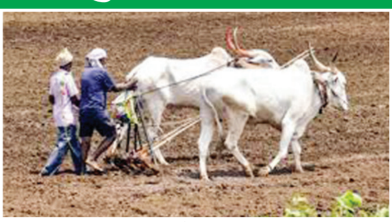
शासकीय योजनांचा लाभ मिळण्याचा मार्ग मोकळा झाला आहे. महसूल विभागाने स्पष्ट केले आहे की, यामुळे शेतजमीन पट्ट्याकार हा 'नोदणी

मुंबई । प्रतिनिधी महाराष्ट्र शासनाने शेतजमीन भाडेपट्ट्याने देण्याच्या प्रक्रियेला कायदेशीर आणि पारदर्शक स्वरूप देण्यासाठी महत्त्वपूर्ण पाऊल उचलले असून, 'महाराष्ट्र शेतजमीन भाडेपट्ट्याने देण्याबाबत अधिनियम, २०१७' तसेच 'नियम २०२४' यांच्या प्रभावी अंमलबजावणीसाठी महसूल विभागाने सविस्तर मार्गदर्शक सूचना जारी केल्या आहेत. या निर्णयामुळे राज्यातील हजारो भूमिहीन, अल्पभूधारक आणि अल्पभूधारक शेतकऱ्यांसाठी शेतीच्या नवीन संधी उपलब्ध होणार असून, पट्टेदार शेतकऱ्यांना आता पीक कर्ज, पीक विमा, आपत्ती निवारण मदत आणि विविध