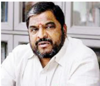
शेतकऱ्यांना होत असेल तर आता शेतकरी चळवळीची गरज राहिलेली नाही, असा टोला त्यांनी लावला. सरकारकडे संशोधन करणाऱ्या अनेक यंत्रणा आहेत. भारतीय कृषी

३,६५० रुपये इतकी जाहीर केली आहे. आम्ही गेली अनेक वर्षे सरकारकडे, स्वामिनाथन आयोगाच्या सुत्राप्रमाणे उत्पादन खर्च अधिक ५० टक्केना म्हणजे दीडपट हमीभाव देण्याची मागणी करत आहोत. पण, केंद्र सरकारने उसाचा जो प्रतिटन १,८२० रुपये खर्च दाखविला आहे; तो कोणत्या उस संशोधन केंद्रात अथवा विद्यापीठात काढला, हे सिद्ध करून दाखवावे, असे आम्हांक त्यांनी दिले आहे. सरकारच्या म्हणण्याप्रमाणे उत्पादन खर्च १,८२० रुपये आणि ३,६५० रुपये एफआरपी घरत्यास सरकार उत्पादन खर्च अधिक १०० टक्केना सरकार घ्यायला लागले आहे, असे म्हणावे लागेल. एवढा नफा जर