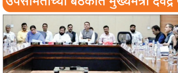
विदर्भ, मराठवाडा, नाशिकसह राज्यातील विविध भागांमध्ये औद्योगिक विकासाला मोठी चालना मिळणार असल्याचे मुख्यमंत्री देवेंद्र फडणवीस यांनी सांगितले. राज्याच्या औद्योगिक धोरणानुसार सामूहिक प्रोत्साहन योजनेअंतर्गत उद्योगांना विविध सवलती व प्रोत्साहने देण्यात

येतात. त्यांतर्गत नवीन उद्योग स्थापन होऊन मोठ्या प्रमाणात गुंतवणूक आकर्षित व्हावी, रोजगार वाढावा आणि औद्योगिक परिसंस्था निर्माण व्हावी, यासाठी विशाल व अतिविशाल प्रकल्पांना विशेष सवलती देण्याबाबत निर्णय घेण्यासाठी मुख्यमंत्री फडणवीस यांच्या अध्यक्षतेखाली मंत्रिमंडळ उपसमिती स्थापन करण्यात