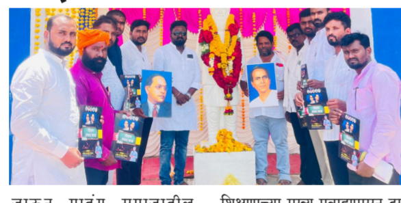
या जाऊन मातंग समाजातील विद्यार्थ्यांना शिक्षणाचे महत्त्व पटवून देणे, शिक्षण गळतीची कारणे समजून घेणे आणि समाजात शैक्षणिक वातावरण निर्माण करणे हा यात्रेचा प्रमुख उद्देश होता. या यात्रेदरम्यान मातंग समाजातील अनेक कुटुंबांशी संवाद साधण्यात आला. समाज

डॉ. बाबासाहेब आंबेडकर यांच्या जयंतीदिनी त्यांच्या स्मारकाला अभिवादन करून या यात्रेची सुरुवात करण्यात आली होती. मागील दीड महिन्यांपासून माजलगाव, वडवणी आणि धारू तालुक्यातील तब्बल ६० गावांमध्ये ही यात्रा पोहोचली. गावोगावी