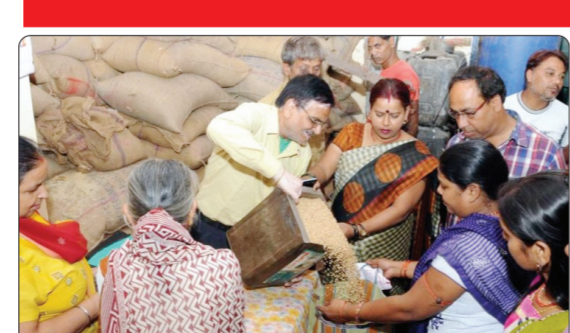
मात्र पेट्रोल-डिझेलचे दर गगनाला भिडत आहेत. मात्र, या गंभीर आर्थिक फटक्याकडे जनतेचे फारसे लक्ष जाऊ नये, यासाठी शासकीय