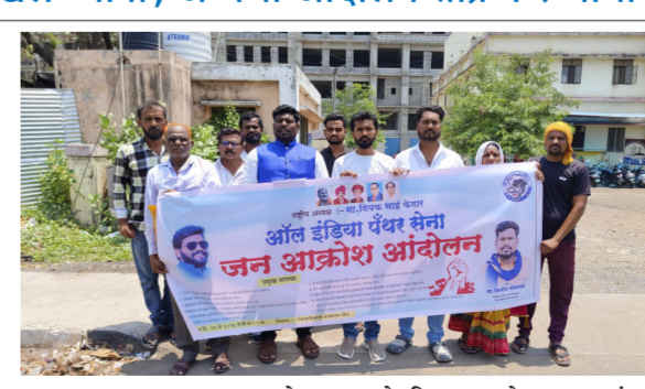
व्यक्त करण्यात आला. तसेच पेपरफुटी प्रकल्प, सुशिक्षित बेरोजगारी, शहरातील अतिक्रमण,

आंदोलनादरम्यान पेट्रोल, डिझेल व घरगुती गॅसच्या वाढत्या महागाई आणि तुटवड्याचा निषेध