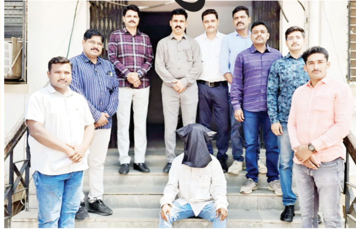
२०२६ रोजी दुकानात हिशोबावरून पुन्हा घोळ झाल्याचे कारण समोर आले.