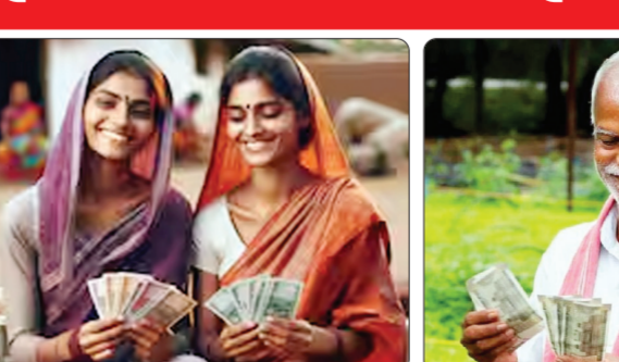
योजनांच्या सुलभ पडदा पुढे करण्यात आल्याची चर्चा आता राजकीय आणि आर्थिक वर्तुळात रंगू लागली आहे. मुख्यमंत्री लाडकी बहीण योजना, शेतकरी सन्मान निधी आणि मोफत अन्नधान्य वितरण यांसारख्या थेट लाभ देणाऱ्या