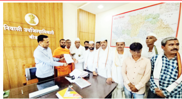
एप्रिल २०२६ रोजी निवेदन देण्यात आले होते. या निवेदनामध्ये नगर परिषद बीड

याबाबत मा. जिल्हाधिकारी बीड यांना दि. २९ एप्रिल २०२६ रोजी तसेच मा. मुख्याधिकारी नगर परिषद बीड यांना दि. २३