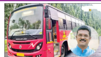
त्यावेळी १२४ कोटी रुपयांचा खर्च वाढला. दुसरी वाढ ९३ पैशांनी झाल्यानंतर ३७२.२० कोटी रुपयांचा खर्च वाढला. तिसरी वाढ ९१ पैशांनी झाल्यानंतर ३६.४० रुपयांनी खर्च वाढला. चौथी दरवाढ २.८१ पैशांनी झाल्यानंतर ११२.४० कोटी खर्च

देशात डिझेल दर वाढीचा मोठा फटका लालपरीला मोठ्या प्रमाणावर बसत आहे. डिझेल वाढीमुळे एसटीचा प्रवास महागणार असल्याची शक्यता दिसून येत आहे. डिझेल वाढीमुळे आतापर्यंत एसटी महामंडळाच्या खर्चात तब्बल ३१० कोटींची वाढ झाली आहे. याआधी ३३०० कोटी रुपयांचा खर्च महामंडळाचा डिझेलवर होत होता. आता याच खर्चात ३१० कोटी रुपयांची वाढ झाली आहे. १५ मेला डिझेलची पहिली वाढ ३.१० पैशांनी झाली,