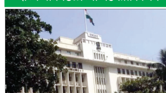
आणि शासकीय कर्तव्ये पार पाडताना होणाऱ्या विलंबास प्रतिबंध अधिनियम २००५ मध्ये सुधारणा करण्यात येणार आहे. त्याबाबतच्या मसुद्यासही मंजुरी देण्यात आली. शासकीय कर्मचाऱ्यांच्या सर्वसाधारण बदल्या