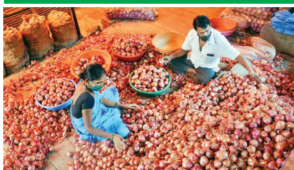
मागील खरीप हंगामात कांदाला सुखातीच्या काळात काही प्रमाणात समाधानकारक दर मिळाले होते. मात्र अतिवृष्टी आणि बदलत्या हवामानामुळे उत्पादनात मोठी घट झाली.

परिणामी ज्या शेतकऱ्यांनी मोठ्या अर्पेक्षेने कांद्याची लागवड केली होती, त्यांना उत्पादन घटल्याने अपेक्षित नफा मिळू शकला नाही. त्यानंतर रब्बी हंगामात परिस्थिती आणखी बिघट झाली. नोव्हेंबरपासून कांद्याचे दर सातत्याने घसरत गेले असून अनेक बाजार समित्यांमध्ये कांद्याचे दर उत्पादन खर्चापेक्षाही कमी राहिले आहेत. सध्या कांदा उत्पादनाचा खर्च प्रतिकिलो सुमारे १८ रुपयांपर्यंत