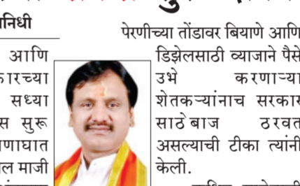
पेरणीच्या तोंडावर बियाणे आणि डिझेलसाठी व्याजाने पैसे उभे करणाऱ्या शेतकऱ्यांचा सरकार साठेबाज ठरवत असल्याची टीका त्यांनी केली. कथित साठेबाजी >> पान २ वर