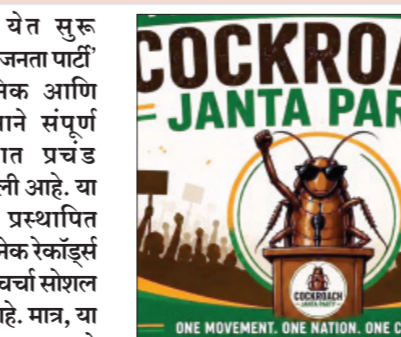
मिळत नसल्याने निर्माण झालेली हतबलता आणि सध्याच्या राजकीय चिखलफेकीला कटाळलेल्या काही सुशिक्षित

बेरोजगारीचा मुख्य मुद्दा पदव्या असूनही हाताला काम नसणे आणि राजकीय पक्षांकडून केवळ आस्वासानाची खेरात मिळणे, याविरुद्धचा हा एक सुशिक्षित आणि शांततापूर्ण निषेध होता.