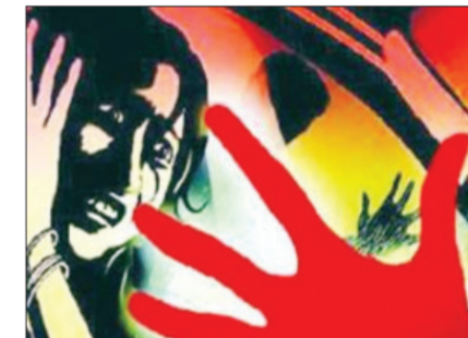
बांगरने वारंवार बळजबरी केली. तसेच, तक्रार देण्याचा प्रयत्न केल्यास >> पान २ वर

बीड शहरातील चन्हाटा रोड भागात राहणाऱ्या आणि हल्ली शहादा जिल्हा नंदुरबार येथे वास्तव्यास असलेल्या महिलेवर अमर