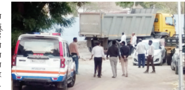
आणि घनसावंगी अंबड तहसीलदार यांच्या प्रत्यक्ष उपस्थितीत सदरील कारवाई करण्यात आली. गोदावरी पात्रातून विनापरवाना वाळू चोरी करून घेऊन जाताना पकडली. गोदावरी नदीपात्रातून बेकायदेशीरपणे वाळू उत्खनन व वाहतूक करणाऱ्या माफियांविरुद्ध अंबड