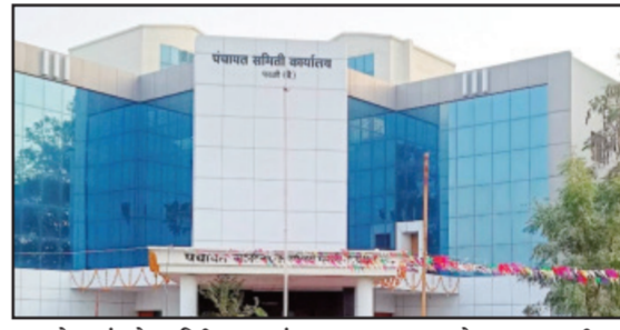
ग्रामसेवकांकडे अतिरिक्त गावांचा कारभार सोपविण्यात आला आहे. सध्या अनेक ग्रामसेवकांकडे एका पदासोबत आणखी ३ ते ४ गावांचा अतिरिक्त कार्यभार असल्याने कामाचा मोठा ताण

परळी वैजनाथ । प्रतिनिधी परळी वैजनाथ पंचायत समिती अंतर्गत ग्रामसेवकांच्या रिक्त पदांचा प्रश्न गंभीर बनला असून याचा थेट परिणाम ग्रामीण भागातील नागरिकांच्या दैनंदिन कामांवर होत आहे. पंचायत समिती अंतर्गत ग्रामसेवकांची एकूण ६२ पदे मंजूर असताना त्यापैकी केवळ ५१ ग्रामसेवक कार्यरत आहेत, तर तब्बल ११ पदे रिक्त आहेत. त्यामुळे अनेक