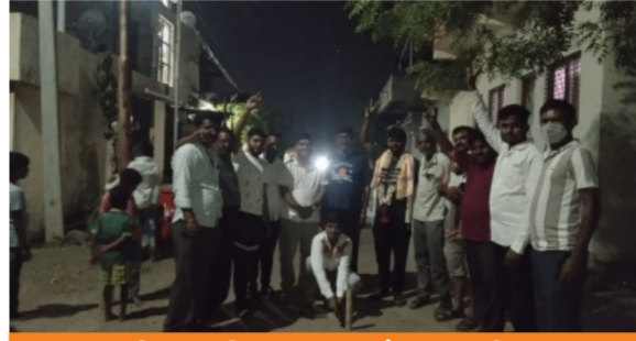
अप्पर विभागीय आयुक्तांकडूनही कायम