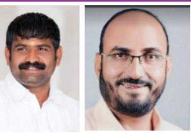
प्रशासकीय कालावधीतील पंधराव्या केंद्रीय वित्त आयोगांतर्गत मंजूर झालेला निधी संबंधित वर्षांमध्ये बीड नगर परिषदेला प्राप्त झाला नव्हता. सदर प्रलंबित निधी आता चालू वर्षात एकरित स्वरूपात नगर परिषदेला