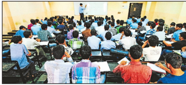
याकडे शिक्षण विभागाचे दुर्लक्ष आहे. विशेष म्हणजे आपलीच शिकवणी

विद्यालये सुरू होताच विद्यार्थ्यांना शिकवणी वगांचे आकर्षण वाटत आहे शहराच्या मुख्य आणि मध्यवर्ती भागात मोठ्या प्रमाणात शिकवणी, कोचिंग क्लासेसवाल्यांनी आपली दुकाने उघडले असून शिक्षणाच्या नावावर चक्र व्यवसायाची दुकाने थाटली आहेत. जास्तीच्या बॅनरबाजी मुळे शहरात शिकवणी वर्ग जोमात असल्याचे दिसून येत आहे. शहरात गेल्या अनेक वर्षांपासून बेरोजगार तरुणांच्या माध्यमातून खाजगी शिकवणी वर्गांचे पेव फुटले असून विद्यार्थ्यांकडून शिकवणी वर्गांच्या नावावर लाखो रुपये जमा होत आहेत.