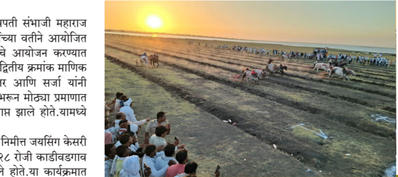
२३४ बैलगाडी शर्यतीत स्पर्धकांचा सहभाग