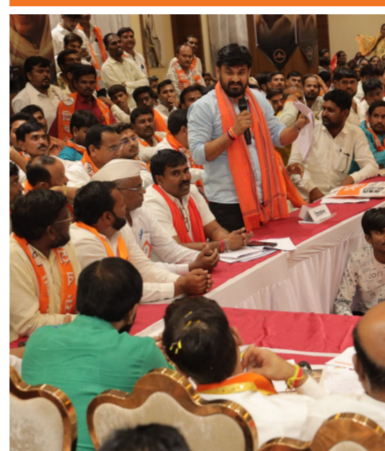
माजलगाव। प्रतिनिधी शिवसेनेच्या राज्यव्यापी 'शिवसंवाद दौऱ्या' अंतर्गत बीड व माजलगाव विधानसभा मतदारसंघातील पदाधिकारी, युवासेना, महिला आघाडी व शिवसैनिकांची आढावा बैठक दि. २९ मे शुक्रवार रोजी उत्साहपूर्ण वातावरणात पार पडली. या बैठकीला शिवसेना नेते तथा खासदार डॉ. श्रीकांत शिंदे यांची प्रमुख उपस्थिती लाभली होती.