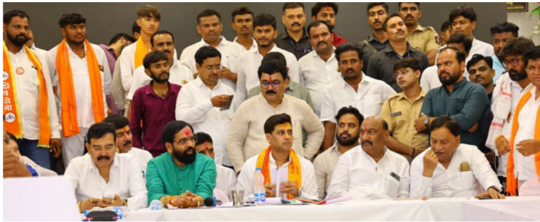
पोहोचवावे. केज व परळी मतदारसंघात शिवसेनेची ताकद वाढत असून आगामी निवडणुकांत त्याचे सकारात्मक परिणाम दिसतील

पडली. या बैठकीत खासदार श्रीकांत शिंदे यांनी आगामी जिल्हा परिषद व पंचायत समिती निवडणुकांच्या पार्श्वभूमीवर पदाधिकारी व कार्यकर्त्यांना मार्गदर्शन केले. विधानसभा मतदारसंघातील जिल्हा परिषद पंचायत समिती वार्ड व पदाधिकाऱ्यांशी सविस्तर चर्चा केली आगामी काळात होणाऱ्या निवडणुकीच्या अनुषंगाने शिवसेनेचा धनुष्यबाण प्रत्येक घरात पोहोचवण्याची जबाबदारी शिवसैनिकांवर दिली खासदार शिंदे म्हणाले की, शिवसेना पक्ष संघटन हेच आपले खरे बळ असून आगामी निवडणुकांमध्ये प्रत्येक बूथवर पक्षाची ताकद दिसली पाहिजे. कार्यकर्त्यांनी जनतेची सातत्याने संपर्क ठेवून शिवसेनेच्या विचारांना घराघरात