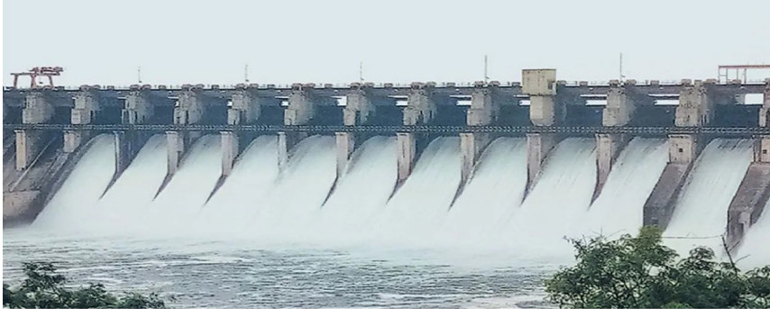
जाते आणि पाण्यासाठी गावागावांत मोठी धावपळ सुरू होते.

उजनी धरणाच्या पाणलोट क्षेत्रात दरवर्षी उन्हाळ्याच्या काळात पाणीटंचाईचा प्रश्न तीव्र स्वरूप धारण करतो. साधारणतः फेब्रुवारीपर्यंत धरणात समाधानकारक पाणीसाठा उपलब्ध असतो; मात्र त्यानंतर पाण्याचा वापर वाढल्याने साठा झपाट्याने कमी होऊ लागतो. एप्रिल-मे महिन्यांत उपयुक्त साठा संयुष्टात येत धरण 'मायनस'मध्ये