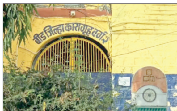
बीड जिल्ह्यामध्ये नेमकं बाहेर जिल्ह्यातील लोक सहज चाललय तरी काय असा प्रश्न विचारून जातात घटनाही

जिल्हा कारागृहातून काल एक ऑडिओ क्लिप व्हायरल झाली होती. या क्लिपमध्ये काही गंभीर स्वरूपाचे आरोप करण्यात आले होते. त्यात कथितपणे एका व्यक्तीवर गोळीबार करण्याचा कट आणि इतर बेकायदेशीर कृत्यांबाबत उल्लेख होता. मात्र आज त्याच प्रकरणाशी संबंधित दुसरी एक ऑडिओ क्लिप समोर आली ज्यात आधीची क्लिप ही दुबाव टाकून बनवली गेली याबाबत सविस्तर लेखी खुलासा संबंधित बंदी कैद्याने केला आहे म्हणजे हा सर्व प्रकार पूर्वनियोजित असल्याचे दिसून येत आहे.