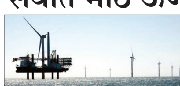
न्यूयॉर्क । वृत्तसंस्था इराण युद्धाच्या परिणामांमुळे जागतिक ऊर्जा सुरक्षा धोक्यात आली आहे. दररोज १३ दशलक्ष बॅरल तेलाचा पुरवठा ठप्प झाला

असे. अमेरिका आणि इराणने होर्मुझची सामुद्रधुनी पुन्हा उघडण्यास नकार दिल्याने गुरुवारी कच्च्या तेलाच्या किमतीत मोठी झेप घेतली आहे. इराणने स्पष्ट केले आहे की, जोपर्यंत अमेरिकन नौदलाची नाकेबंदी सुरू आहे, तोपर्यंत हा जलमार्ग बंदच राहील. यामुळे ब्रेंट क्रूड ३.६२% वाढीसह १०५.६३ डॉलर्स प्रति बॅरलवर पोहोचले. तर डब्ल्यूटीआय क्रूड ४.०६% पान २ वर