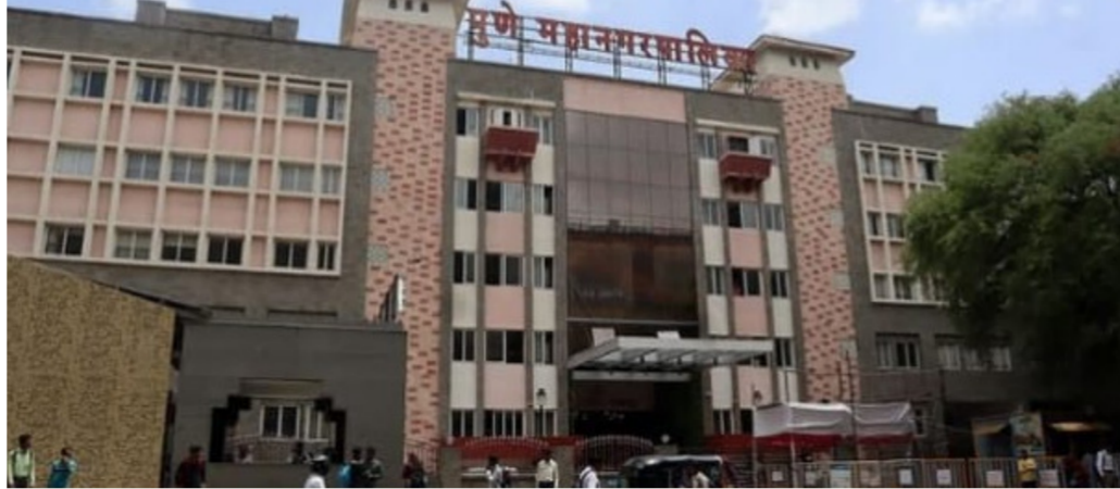
रस्त्या पर्यंत सुमारे अडीच किलोमीटरची नवीन १००० मिमी व ५०० मिमी व्यासाची जलवाहिनी टाकण्यात येणार आहे. त्यासाठी पालिकेने वर्षभरापूर्वी जलसंपदा विभागाकडे कामाला मान्यता देण्याची

देण्यात आली आहे. पालिकेकडून ही जलवाहिनी कालव्याच्या शेजारून टाकण्यात येणार होती. मात्र, या मार्गावर आधीच पावसाळी जलवाहिनी, ड्रेनेज लाईन, मेट्रो, उड्डाणपूल तसेच इतर पायाभूत सुविधा अस्तित्वात आहेत. त्यामुळे नव्याने जलवाहिनी टाकताना तांत्रिक अडचणी निर्माण होण्याची शक्यता होती. तसेच काही ठिकाणी नाला क्रॉसिंगच्या ठिकाणी काम अधिक गुंतागुंतीचे होण्याची शक्यता होती. त्यामुळे रस्ता खोदकाम टाळण्यासाठी कालव्याच्या बांधामधून जलवाहिनी टाकण्याचा पर्याय निवडला आहे. पालिकेकडून पर्वती जलकेंद्र ते मित्रमंडळ चौकातून पुढे पंडीत नेहरू