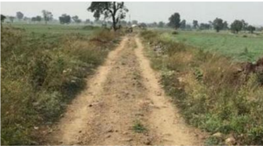
चंद्रशेखर बावनकुळे यांनी दुहेरी रस्त्याबाबत आदेश काढले जातील, असे आश्वासन दिले होते. त्यामुळे

नुकत्याच झालेल्या पावसाळी अधिवेशनादरम्यान विधान परिषदेत लक्षवेधी सूचनेद्वारे हा मुद्दा उपस्थित करण्यात आला होता. एखाद्या शेतकऱ्याला योग्य रस्ता असतानाही केवळ वैयक्तिक फायद्यासाठी दुसऱ्या रस्त्याची मागणी केली जाते, अशी मागणी फेटाळली पाहिजे, असा मुद्दा आमदारानी मांडला होता. त्यावर महसूलमंत्री