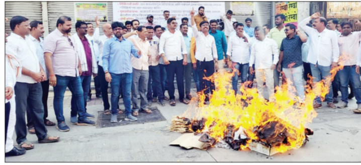
विक्रेत्यांना थेट 'आरोपी' न करता गुणवत्ता तपासणीसाठी प्रशासनाकडून घेण्यात आलेल्या नमुन्यांची अनेक 'साक्षीदार' म्हणून वागणूक घ्यावी.

विक्रेत्यांनी सरकारसमोर १४ प्रमुख मागण्या मांडल्या आहेत, ज्यामध्ये कंपन्यांकडून खतांचा पुर्वदा करताना इतर अनावश्यक उत्पादने (लिफ्टिंग) विक्रेत्यांच्या माथी मारणे थांबवावे. अवैध एचटीबीटी बियाण्यांच्या तस्करीवर कठोरपणे आळा घालण्यात यावा. 'साधी' पोर्टल अॅप वापरण्याची सक्ती केवळ किरकोळ विक्रेत्यांवर न ठेवता ती उत्पादक आणि पुर्वदादार कंपन्यांच्या स्तरावर लागू करावी. बियाण्यांचे नमुने निकृष्ट आढळल्यास