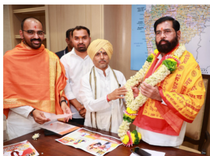
जुनी २०२६ रोजी मठा मंडळाच्या सहानुभूतीने तारकेश्वर गडावर उपमुख्यमंत्री एकनाथ शिंदे यांना निमंत्रण दिले आहे.