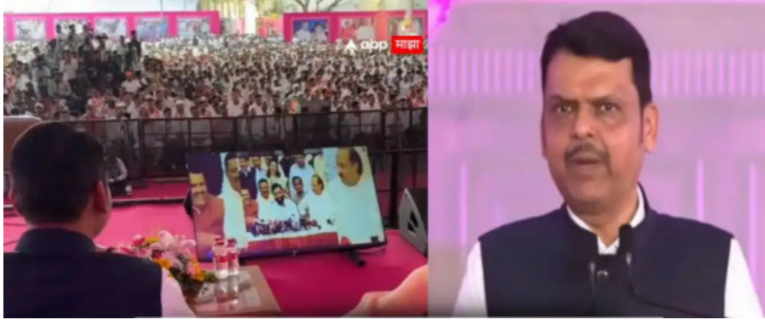
येथील, असा विश्वास देखील त्यांनी व्यक्त केला.

गेल्यानंतर निवडणूक आपण बिनविरोध करतो. शरद पवार यांचे आभार मानतो, त्यांचा मला काल फोन आला होता. त्यांनी मला सांगितलं की, आमचा सुनेत्रा पवारांना पूर्ण पाठिंबा आहे. मी कॉंग्रेस प्रदेशाध्यक्षां देखील विनंती केली, त्यांनी ती विनंती मान्य केली. बारामतीमध्ये सभा घेताना माझ्यापैकी कुणीही आलं नसतं तरी बारामतीकरांनी रेकॉर्ड ब्रेक मतांनी सुनेत्रा वहिनींना निवडून दिले असते. आताचा काळ दादांच्या स्मृतीच्या आठवणींच्या यज्ञाचा काळ आहे. त्यामुळे, प्रत्येकजणाने आपली मतरुपी आहुती यात द्यायला पाहिजे. ती आहुती दिली नाही तर तो आपण स्वतःला करंटे ठरू, असे आवाहन फडणवीसांनी बारामतीकरांना केले. तसेच, बारामतीतून सर्वाधिक मतांनी निवडून घेण्याचा रॅडॅंड अजित दादांचा आहे, आता दादांच्या पश्चात रेकॉर्ड ब्रेक मतांनी वहिनी निवडून