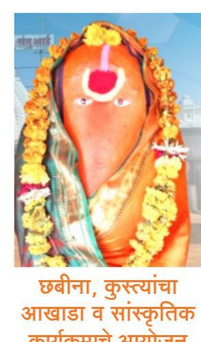
छबीना, कुस्त्यांचा आखाडा व सांस्कृतिक कार्यक्रमाचे आयोजन

सिरसमार्ग। प्रतिनिधी गेवराई तालुक्यातील सिरसमार्ग येथील ग्रामदैवत श्री क्षेत्र सुभान संतुआई देवीची यात्रा मंगळवारीपासून सुरू होत असून, यात्रे निमित्त विविध कार्यक्रमाचे आयोजन करण्यात आले असून, भाविकांनी या यात्रेस्वास्त्य मोठ्या संख्येने उपस्थित राहवे असे आवाहन यात्रा समितीने केले आहे. गेवराई तालुक्यातील सिरसमार्ग येथील ग्रामदैवत श्री क्षेत्र सुभान संतुआई देवीच्या यात्रेला मंगळवारीपासून सुरुवात होत आहे. रविवारी अक्षय्य वृत्तीचा यादिवशी सिरसमार्ग व परिसरातील भाविक श्रीक्षेत्र राक्षसभुवन या ठिकाणी गौदवरी नदीचे पाणी आणण्यासाठी कावडी घेऊन पायी जातात. दि.२१ एप्रिल रोजी सकाळी संतुआई देवी सह गावातील देव देवतांचा जलाभिषेक केला जाणार आहे. गावांमध्ये कावडीची वेल ताशा च्या संवाधा जाऊन