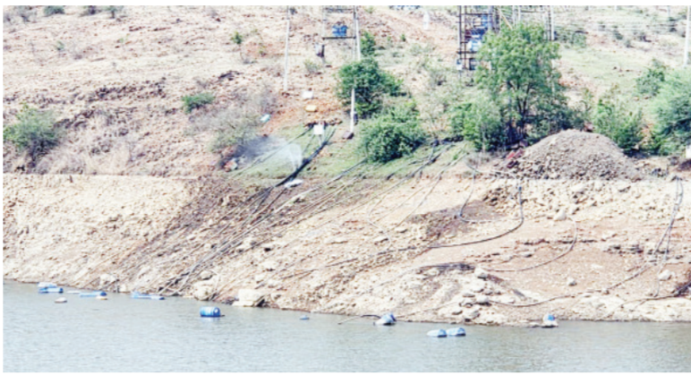
प्रत्यक्षात कोणतीही ठोस उपाययोजना होत नसल्याची टीका त्यांनी केली आहे.