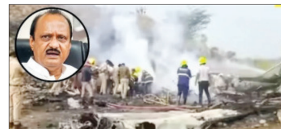
प्रकरणाचा तपास करणार आहे. समोर आलेल्या माहितीनुसार, आमदार रोहित पवार यांनी या अपघाताबाबत संशय व्यक्त करत सखोल तपासाची मागणी केली होती. त्यांच्या आग्रहांनंतर कर्नाटक पोलिसांनी झिरो

कर्नाटकात दाखल झालेला हा गुन्हा झिरो एफआयआरद्वारे महाराष्ट्रात वर्ग करण्यात आला असून, बारामती पोलिसांनंतर आता राज्य सीआयडी या