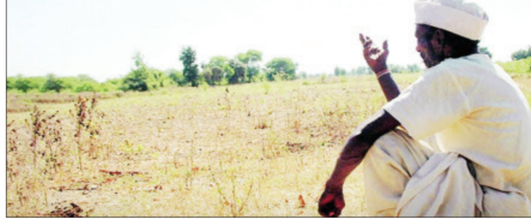
त्यामुळे शेतकऱ्यांमध्ये संभ्रम आणि नाराजीचे वातावरण निर्माण झाले आहे. फेब्रुवारी-मार्चमधील अर्थसंकल्पीय

राज्य शासनाने अर्थसंकल्पीय अधिवेशनात जाहीर केलेल्या 'पुण्यश्लोक अहिल्यादेवी होळकर कर्जमाफी योजना'कडून शेतकऱ्यांना मोठ्या अपेक्षा होत्या. ३० सप्टेंबर २०२५ पर्यंतच्या थकबाकीदार शेतकऱ्यांना २ लाख रुपयांपर्यंत कर्जमाफी देण्याचे आश्वासन देण्यात आले होते. मात्र खरीप हंगाम तोंडावर येऊनही या योजनेची अंमलबजावणी अद्याप सुरु झालेली नसून निकषही स्पष्ट करण्यात आलेले नाहीत.