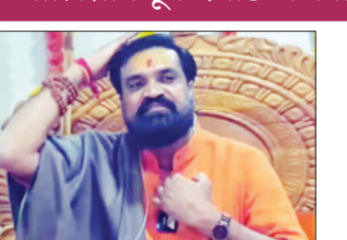
न्यायालयाने पाच दिवसांची पोलीस कोठडी सुनावली आहे. सध्या या प्रकरणाचा तपास वेगाने सुरु असून गडगेच्या कथित दरबारामागील संपूर्ण जाळ उघड करण्याचा पोलिसांचा प्रयत्न आहे. या कारवाईमुळे परिसरात

खळबळ उडाली असून अंधश्रद्धेच्या नावाखाली भोंदूगिरी करणाऱ्यांचे धाबे टणणले आहेत. अहिल्यानगरमधील संगमनेरच्या भोंदू बाबाचा आणखी एक प्रताप समोर आला आहे. पोटाचा आजार दूर करण्याच्या आणि लग्न जमवून देण्याच्या नावाखाली या भोंदूंनी बीडमधील तरुणाची फसवणूक केल्याचा आरोप करण्यात आला आहे. यासाठी भोंदूंनी तब्बल २२ हजार रुपये उकळत्याची माहिती तरुणाने दिली. याबाबत तरुणाने भोंदू बाबाबाबत माजलगाव ▶▶ पान २ वर