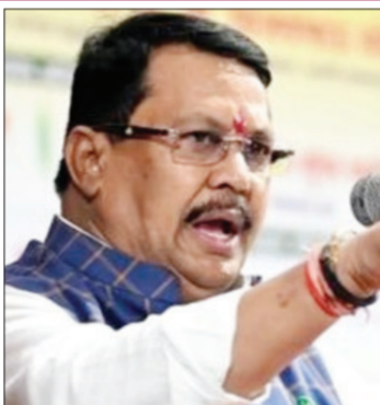
असताना आचारसंहितेचे उल्लंघन करण्यात आले आहे. शनिवारी पंतप्रधान यांचे भाषण नव्हते तर राजकीय नेत्यांचे भाषण होते. मोदींना ५० वेळा काँग्रेसचे नाव का घ्यावे लागते, एवढी काँग्रेसची का भीती वाटते आहे. ? परकियांना देशावर आक्रमण केले तेव्हा शिवाजी महाराजांचे