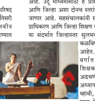
आहे. उर्दू माध्यमासाठी हे प्रशिक्षण केवळ राज्य आणि जिल्हा अशा दोनच स्तरांवर आयोजित केले जाणार आहे. सहसंचालकांनी सर्व प्रादेशिक विद्या प्राधिकरण आणि जिल्हा शिक्षण व प्रशिक्षण संस्थांना या संदर्भात जिल्हास्तर सुलभकांची नावे त्वरित कळविण्याचे आदेश दिले आहेत. नवीन अभ्यासक्रम वर्गात शिकवतांना शिक्षकांना कोणत्याही अडचणी येऊ नयेत आणि अध्यापन प्रक्रिया सुलभ व्हावी, हा या प्रशिक्षणाचा मुख्य हेतू असल्याचे स्पष्ट

पुणे । प्रतिनिधी राज्य शैक्षणिक संशोधन व प्रशिक्षण परिषद अर्थात विद्या प्राधिकरणाच्या वतीने दुसरी, तिसरी आणि चौथीच्या शिक्षकांसाठी नवीन अभ्यासक्रमांनुसार प्रशिक्षणाचे आयोजन करण्यात आले आहे. २०२६-२७ या शैक्षणिक वर्षापासून लागू होणाऱ्या नवीन अभ्यासक्रमाचा प्रभावी अंमलबजावणीसाठी हे पाऊल उचलण्यात आले आहे. ४ मेपासून सुरू होणाऱ्या या प्रशिक्षणासाठी शिक्षकांनी उपस्थित राहणे बंधनकारक आहे. नवीन शैक्षणिक वर्ष १५ जून २०२६ पासून सुरू होत आहे. त्यापूर्वी सर्व शिक्षकांचे प्रशिक्षण पूर्ण करण्याचे उद्दिष्ट शासनाने ठेवले आहे. हे प्रशिक्षण राज्य, जिल्हास्तर आणि तालुकास्तर अशा तीन टप्प्यांवर पार पडणार आहे. राज्यस्तरीयासाठी ४ ते ७ मे २०२६ रोजी मराठी व उर्दू माध्यमासाठी, जिल्हास्तर ११ ते १४ मे दरम्यान मराठी व अन्य माध्यमांसाठी, तर तालुकास्तर प्रशिक्षण १८ ते ३० मे दरम्यान मराठी व अन्य माध्यमांसाठी हे प्रशिक्षण होणार