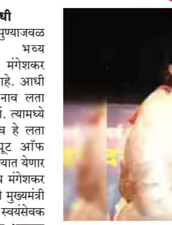
होता. मात्र अलीकडेच आशा भोसले यांच्या निधनानंतर त्यांच्या नावाचाही समावेश करण्याचा निर्णय घेण्यात आला आहे. त्यामुळे या संस्थेचं नाव आता 'लता आशा मंगेशकर इन्स्टिट्यूट ऑफ मेडिकल सायन्सेस' असं ठेवण्यात येणार

पुणे । प्रतिनिधी मंगेशकर कुटुंबीयांकडून पुण्याजवळ उभारल्या जाणाऱ्या भव्य हॉस्पिटलसंदर्भात हृदयनाथ मंगेशकर यांनी मोठी घोषणा केली आहे. आधी या हॉस्पिटलचे नियोजित नाव लता मंगेशकर हॉस्पिटल असं होतं. त्यामध्ये आता बदल करून नवं नाव हे लता आशा मंगेशकर इन्स्टिट्यूट ऑफ मेडिकल सायन्सेस असं ठेवण्यात येणार असल्याची माहिती हृदयनाथ मंगेशकर यांनी दिली. १६ एप्रिल रोजी मुख्यमंत्री देवेंद्र फडणवीस आणि राष्ट्रीय स्वयंसेवक संघाचे सरसंघचालक मोहन भागवत यांच्या उपस्थितीत या हॉस्पिटलचं भूमिपूजन होणार असल्याची माहिती हृदयनाथ मंगेशकर यांनी पत्रकार परिषदेत दिली. या हॉस्पिटलला आधी केवळ लता मंगेशकर यांचं नाव देण्याचा निर्णय झाला