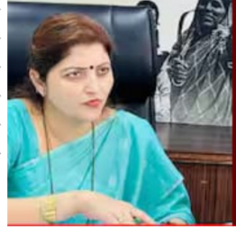
महाराष्ट्राच्या राजकीय क्षेत्रात आजतागायत अनेकांवर आरोप झाले, त्या आरोपांचे पुरावे माध्यमांनी संबंध महाराष्ट्राला दाखवले व आरोप करणाऱ्यांनीही पुराव्यानिशी आरोप केले. मात्र, आज २८ दिवस होत आहेत, माझ्या व माझ्या परिवारावर बेछूट व कपोलकल्पित आरोप हे फक्त हेतुपुरस्सर व बदनाम करण्यासाठी होत आहेत, हे वेळोवेळी समोर येत आहे. याबाबतीत आरोप करणाऱ्यांनी ना पुरावे दिले ना प्रसार माध्यमांनी ते

आहे. कुठल्याही पुराव्याच्या आधारे कुणीतरी लिहिलेल्या पत्रावरून आपणास आरोपीच्या पिंजऱ्यात उभं केल्याची भावना त्यांनी सोशल मीडियातून व्यक्त केेली. तसेच, एसआयटी तपास निष्पक्षपणे व्हावा म्हणूनच आपण मीडियापुढे आलो नाही, असेही त्यांनी म्हटले.