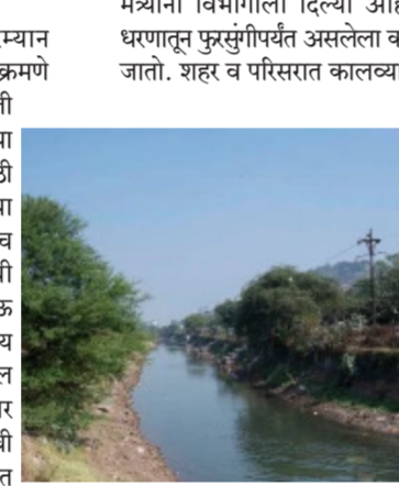
मंत्र्यांनी विभागाला दिल्या आहेत. खडकवासला धरणाला फुरसुंगीपर्यंत असलेला कालवा पुणे शहरातून जातो. शहर व परिसरात कालव्याच्या भागात अनेक

खडकवासला । प्रतिनिधी खडकवासला धरण ते फुरसुंगी दरम्यान असलेल्या कालवा परिसरात झालेली अतिक्रमणे काढण्यासाठी जलसंधारण विभागाने कंबर कसली आहे. येथील झोपडपट्ट्यांना नोटीसा बजावल्या असून कालव्याच्या प्रत्येक पाच किलोमीटरसाठी चार अभियंतं असे अतिरिक्त ५० अभियंते या मोहिमेसाठी नियुक्त केले आहेत. तसेच कालव्याच्या परिसरातील झोपडपट्ट्यांची अतिक्रमणे काढल्यानंतर पुन्हा अतिक्रमण होऊ नये, यासाठी तेथे सीमा भित्त उभारण्याचा निर्णय घेतला आहे. खडकवासला धरण परिसरातील वाढत्या अतिक्रमणांबाबत तक्रारी आल्यानंतर जलसंधारण विभागाने तक्रारी याची गंभीर दखल घेत ही अतिक्रमणे तातडीने काढवीत असे आदेश जलसंधारण विभागाला दिले होते. त्यानुसार गेल्या महिन्यापासून अतिक्रमण काढण्याची मोहीम विभागाने हाती घेतली होती. यापूर्वी धरण परिसरातील १०० अतिक्रमणे काढण्यात आली असून कालव्यावरील २५ हेक्टरपैकी पाच हेक्टर क्षेत्र अतिक्रमणमुक्त करणाऱ्या आल्याची माहिती विभागाने दिली. ही मोहीम आणखी कडक करण्याच्या सूचना