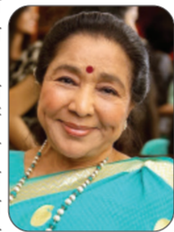
आशा भोसले यांचा जन्म ८ सप्टेंबर १९३३ रोजी सांगली येथे झाला. त्यांनी पहिले गाणे १९४३ मध्ये माझा बाळ चित्रपटासाठी वयाच्या दहाव्या वर्षी गायले होते. पिया तू अब तो आजा, दम मारो दम, ये मेरा दिल, चुग लिया है तुमने, आँखों की मस्ती के आणि दिल चीज क्या है यासारखी सुपरहिट गाणी त्यांनी गायिली. त्यांनी त्यांच्या कारकिर्दीत १२ हजारांहून अधिक गाणी

निधनाने संपूर्ण देशभर तसेच हिंदी, मराठी चित्रपटसृष्टी, गायन आणि कला क्षेत्रात शोककळा पसरली आहे. आशा भोसले यांनी त्यांच्या ८० वर्षांच्या प्रदीर्घ कारकिर्दीत चित्रतरुण आवाजाने संपूर्ण देशातील तसेच जगभरातील चाहत्यांची मने जिंकली. त्यांच्या पार्थिवावर सोमवारी सायंकाळी ४ वाजता शिवाजी पार्क येथे शासकीय इतमामात अंत्यसंस्कार होणार आहेत.