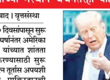
मध्य-पूर्वेतील तणाव आणि 'होमुझची सामुद्रधुनी' उघडण्याच्या मुद्द्यावर मार्ग काढण्यासाठी दोन्ही देशांचे प्रतिनिधी आमनेसामने बसले होते. रविवारी पहाटे पत्रकार परिषदेत बोलताना जेडी व्हान्स

गेल्या ४० दिवसांपासून सुरू असलेल्या संघर्षानंतर अमेरिका आणि इराण यांच्यात शांतता प्रस्थापित करण्यासाठी सुरू असलेले प्रयत्न तूटस अपयशी ठरले आहेत. पाकिस्तानची राजधानी इस्लामाबाद येथे तब्बल २१ तास चाललेल्या उच्चस्तरीय चर्चेनंतर कोणताही ठोस करार होऊ शकला नाही, अशी माहिती अमेरिकेचे उपराष्ट्रपती जेडी व्हान्स यांनी दिली आहे.