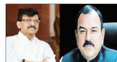
डिटेल रेकॉर्ड) ही अत्यंत संवेदनशील माहिती असते. ती मला सहज मिळणार नाही किंवा व्हॉट्सअपवर पाठवली जाणार नाही. गृहमंत्री किंवा मुख्यमंत्र्यांच्या परवानगीशिवाय कोणालाही मिळू शकत नाही. मग ही माहिती कोणापर्यंत आणि कशी पोहोचली, हा मोठा प्रश्न आहे. 'दोंगी बाबा खरातच्या पायाशी बसून फडणवीस यांच्या कार्यकाळातील