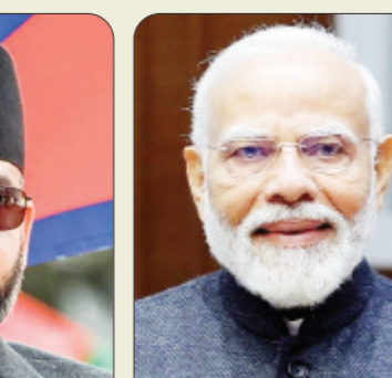
कडक पावले उचलली आहेत. नेपाळमधील १०० कलमी कार्यक्रमांतर्गत त्यांनी शाळांमधून

वर्षांच्या या तरुण इंजिनीअरने नेपाळच्या राजकारणातील जुन्या प्रस्थापितांना धूळ चारली आणि सत्तेवर येताच खासगी शाळांच्या मकेदारीला लगाम घालण्यासाठी