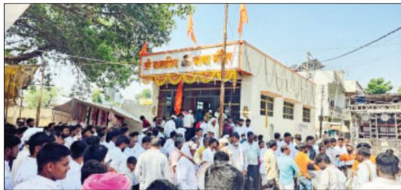
बीड । प्रतिनिधी

तालुक्यातील जिरेवाडी येथे सालशिद बाबा यात्रेला मोठ्या उत्साहात सुरुवात झाली असून परिसरातील भाविकांमध्ये गजरात लेझीम खेळत सालशिद बाबांची भव्य मिरवणूक काढण्यात आली. तसेच रात्रीच्यावेळी