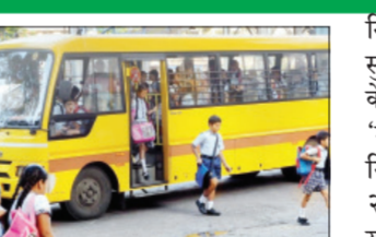
नियमावली जाहीर करण्याची तयारी सुरू केली आहे. गृह विभागाने प्रसिद्ध केलेल्या मसुदा अधिसूचनेनुसार, 'महाराष्ट्र मोटार वाहन (शालेय बस नियम) (प्रथम सुधारणा) नियम, २०२६' लागू करण्याचा प्रस्ताव असून, यात सुरक्षितता, पारदर्शकता आणि जबाबदारी यावर विशेष भर देण्यात आला आहे. या बाबतीत अधिसूचना जाहीर झालेल्या दिनांकापासून पंधरा दिवस या विहित वेळेत संबंधित संकेतस्थळावर सर्वसामान्य जनतेकडून हक्कती व सूचना मागविण्यात आल्या असून त्याला >> पान २ वर

महाराष्ट्रात स्कूल बसच्या भाडे नियंत्रणासंदर्भात मोठी बातमी समोर आली आहे. यात नवीन नियमांनुसार शालेय बसचे भाडे आता प्रादेशिक परिवहन प्राधिकरणाकडून निश्चित केले जाणार आहे. परिणामी, विद्यार्थ्यांकडून फक्त मासिक भाडेच आकारले जाईल. तर आगाऊ रक्कम घेण्यास मनाई करण्यात आली आहे. त्यामुळे पालकांना आर्थिक दिलासा मिळणार आहे. शालेय वाहतूक व्यवस्थेबाबत सुरक्षित, पारदर्शक आणि उत्तरदायी