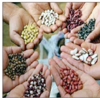
विक्री होत असल्याच्या तक्रारी वाढल्या आहेत. यामुळे उत्पादनावर परिणाम होऊन शेतकऱ्यांचे मोठे आर्थिक नुकसान होत आहे.

खरीप हंगाम २०२६च्या पाखंडात खरीपात बोगस बियाणे विक्रेत्यांवर फौजदारी कारवाईचा इशारा देण्यात आला आहे. शेतकऱ्यांची फसवणूक रोखण्यासाठी कृषी विभागाची मोठी मोहीम सुरू आहे. शेतकऱ्यांची फसवणूक रोखण्यासाठी कृषी विभागाची मोठी मोहीम सुरू आहे. शेतकऱ्यांची फसवणूक रोखण्यासाठी कृषी विभागाची मोठी मोहीम सुरू आहे.