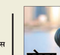
कठीण होते. दुसरीकडे, भारताचे पंतप्रधान नरेंद्र मोदी हे गेल्या दशकापासून जगातील सर्वात लोकप्रिय नेत्यांपैकी एक आहेत. या दोघांच्या कामात काही साम्य आहे, तर काही टोकाचे फरकही आहेत. बालीन शाह यांनी सत्तेवर येताच खासगी शाळांच्या मकेदारीला लगाम घालण्यासाठी

नेपाळचे नवनिर्वाचित पंतप्रधान बालेंद्र शाह (बालीन शाह) यांनी गेल्या काही काळात घेतलेले निर्णय आणि त्यांची कार्यपद्धती सध्या जगभरात चर्चेचा विषय ठरत आहे. रंपर ते पंतप्रधान असा त्यांचा प्रवास एखाद्या चित्रपटासारखा असला, तरी त्यांचे निर्णय अत्यंत व्यावहारिक आणि धाडसी आहेत. नेपाळ हा भौगोलिक दृष्ट्या छोटा देश आहे भारत हा भौगोलिक दृष्ट्या मोठा देश आहे त्यामुळे नेपाळमध्ये ही कार्यपद्धती योग्य ठरू शकते मात्र भारतामध्ये ही कार्यपद्धती अमलगत आणण्यासाठी वेळ लागत असला तरी अगदी त्याच पद्धतीने निर्णय घेतले तर चांगले ठरतील, अशी सध्या तरी समाज माध्यमांमध्ये चर्चा सुरू आहे.