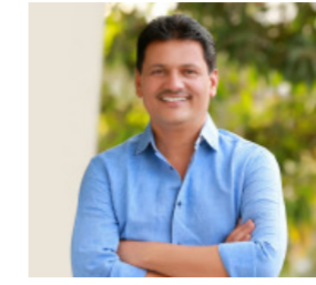
बीड । प्रतिनिधी