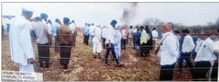
महासांगवी आणि कवडवाडी ग्रामपंचायतीच्या हद्दीत जन्मुविधा किंवा इतर कोणत्याही शासकीय योजनेअंतर्गत तात्काळ स्मशानभूमी मंजूर करावी, असा

मिळालेल्या माहितीनुसार, काल महासांगवी येथे एका वयोवृद्ध व्यक्तीचे निधन झाले. मात्र, गावात हक्काची स्मशानभूमी उपलब्ध नाही. त्याच पावसाणे हेजरी लावल्यामुळे आणि स्मशानभूमीकडे जाणाऱ्या रस्त्याची दुर्दशा झाल्यामुळे मृतदेहावर वेळेत अंत्यसंस्कार करणे अशक्य झाले. रस्ता चिखलमय झाल्याने आणि पावसापासून संरक्षणासाठी कसलीही शेड नसल्याने नातेवाईकांना व ग्रामस्थांना अंत्यविधीसाठी दुसऱ्या दिवसाची वाट पहावी लागली. या घटनेमुळे संपूर्ण गावात संताप आणि हळहळ व्यक्त केली जात आहे.