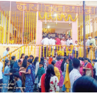
मनमुराद लाभ घेतला. वडवणी येथील यंदाचा श्री.हनुमान जन्मोत्सव काहीसा

वडवणी । प्रतिनिधी वडवणी शहरातील मोठा मारोती मंदिर याठिकाणी काल दि.२ एप्रिल २०२६ गुरुवार रोजी श्री.हनुमान जन्मोत्सव मोठ्या हर्षोल्लासात व उत्साहाचा वातावरणात भक्तीभावाने साजरा करण्यात आला. सकाळी ठीक सव्वा सहा वाजता सूर्योदयाबरोबर मारोतीरायाचा हा जन्मोत्सव सोहळा संपन्न झाला. त्यानंतर संपूर्ण शहरातून पालखी मिरवणूक काढण्यात आली व याप्रसंगी आयोजित करण्यात आलेल्या महाप्रसादाचाही हजारो भाविकांनी