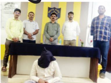
अनोळखी व्यक्तींनी त्यांच्याशी संवाद साधला आणि "तुम्हाला चमत्कार पाहायचा आहे का?" अशी विचारणा केली. भामट्यांनी जाधवर यांची ६ ग्रॅमची सोन्याची अंगठी

बीड । प्रतिनिधी चमत्कार दाखवतो असे सांगून एका वयोवृद्ध व्यक्तीची सोन्याची अंगठी लंपास करणाऱ्या सराईत चोरट्याला बीड स्थानिक गुन्हे शाखेने अटक केली आहे. पोलिसांनी या कारवाईत चोरी गेलेली अंगठी आणि गुन्हात वापरलेली मोटारसायकल जप्त केली आहे.