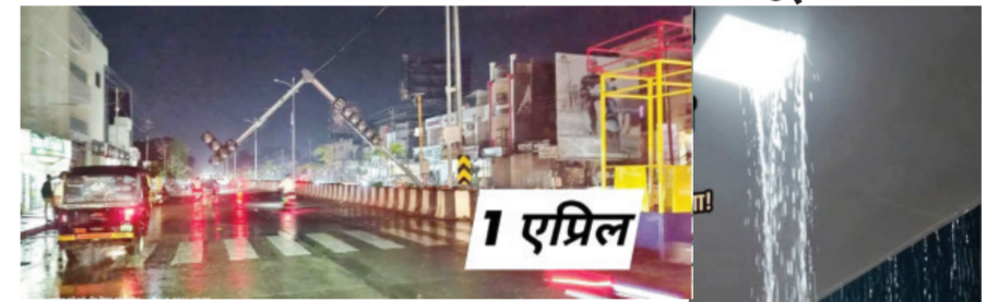
नव्हे तर बीड शहरामध्ये नव्यानेच बांधण्यात आलेले बस स्थानकही पहिल्याच अवकाळी पावसामध्ये गळू लागल्याने प्रवाशांची तारांबळ उडाली. या गुनेदारांवरही कारवाई करून हे थातूरमातूर केलेले काम पुन्हा करावे अशी अपेक्षा प्रशासनाकडून केली जात आहे.

बीड । प्रतिनिधी बीड शहरातील साठे चौक छत्रपती शिवाजी महाराज पुतळ्याजवळ तसेच नगर नाक्यावर तीन ठिकाणी नवीन सिग्रल बसवण्यात आले होते. या सिग्रलचे काम अजून पूर्णही झाले नाही. मात्र एक एप्रिल रोजी झालेल्या अवकाळी पावसात नगर नाक्यावरील सिग्रल कोसळले. थातूरमातूर आणि बोगस काम करणाऱ्या या कंत्राटदारावर कारवाई करण्याचा इशारा नगरपालिका प्रशासनाने दिला असल्याचे समजते. एवढेच