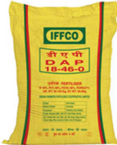
कृषी मंत्री दत्तात्रय भरणे म्हणाले की, खत उत्पादक व पुरवठादार कंपन्यांनी खते उपलब्ध होण्यापूर्वी कृषी विकास अधिकारी