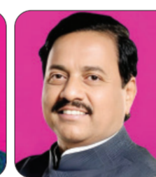
पवार यांच्याकडे स्पष्टीकरण दिल्याची माहिती