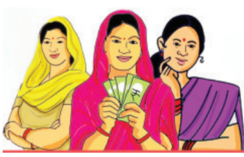
अदिति तटकरे यांनी याबाबत माहिती दिली आहे.

लाडकी बहीण योजनेसाठी ई-केवायसी करण्याची शेवटची मुदत ३१ मार्च २०२६ रोजी म्हणजे काल संपली होती. पण आता लाडक्या बहिणींसाठी पुन्हा एकदा एक मोठी बातमी आहे. लाडक्या बहिणींना आता आपली ई-केवायसी करण्यासाठी मुदतवाढ देण्यात आली आहे. आता ई-केवायसीची शेवटची मुदत ३० एप्रिल २०२६ आहे. त्यामुळे लाडक्या बहिणींना दिलासा मिळाला आहे. राज्याच्या महिला व बाल विकास मंत्री