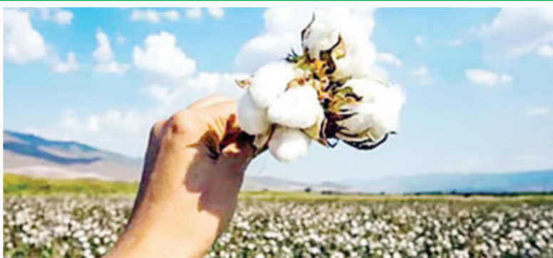
प्रशासनाने सांगितले आहे. शासनाने केवळ बीजी-१ आणि बीजी-२ (बोलगार्ड-२) या कापूस वाणांनाच कृषी विभागाच्या माहितीनुसार, सध्या

खरीप हंगामाची तयारी वेगाने सुरू असताना कृषी विभागाने शेतकऱ्यांना महत्वाचा इशारा देत बेकायदेशीर कापूस बियाण्यांच्या वापरापासून दूर राहण्याचे आवाहन केले आहे. विशेषतः बीजी-३ (एचटीबीटी) कापूस बियाण्यांच्या वापर टाळावा, अन्यथा कठोर कारवाईला सामोरे जावे लागेल, असे स्पष्ट करण्यात आले आहे. नियमांचे उल्लंघन केल्यास पाच वर्षांपर्यंत कारावास आणि एक लाख रुपयांपर्यंत दंडाची तरतूद असल्याने शेतकऱ्यांनी विशेष दक्षता बाळगावी, असे