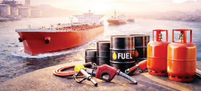
दिल्ली । प्रतिनिधी जागतिक तणावाच्या पार्श्वभूमीवर विशेषतः हॉर्मुज सामुद्रधुनी बंद होण्याच्या शक्यतेमुळे देशात पेट्रोल, डिझेल आणि एलपीजीच्या उपलब्धतेबाबत चिंता व्यक्त होत असताना केंद्र सरकारने नागरिकांना महत्वाचे आश्वासन दिले आहे. देशात इंधनाचा पुरवठा मुबलक असून घाबरून खरेदी करण्याची कोणतीही गरज

नसल्याचे सरकारने स्पष्ट केले आहे. अमेरिका-इराण तणावामुळे आंतरराष्ट्रीय बाजारपेठेत अस्थिरता निर्माण झाली असली, तरी भारतातील इंधन पुरवठ्यावर त्याचा कोणताही तात्काळ परिणाम झालेला नाही. पेट्रोलियम आणि नैसर्गिक वायू मंत्रालयाच्या माहितीनुसार, देशातील सर्व रिफायनरी पुरेशा कच्च्या तेलाच्या साठ्यासह कार्यरत आहेत. पेट्रोल पंपांवरही इंधनाचा पुरेसा साठा उपलब्ध असल्याचे स्पष्ट करण्यात आले आहे. घरगुती वापरासाठी एलपीजी आणि पाइप नॅचुरल गॅसला प्राधान्य देण्यात आले असून