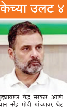
या मुद्द्यावरून केंद्र सरकार आणि पंतप्रधान नरेंद्र मोदी यांच्यावर थेट

परराष्ट्र धोरण आणि ऊर्जा सुरक्षेच्या मुद्द्यावर काँग्रेसमध्ये अंतर्गत मतभेद असल्याचे या विधानांवरून स्पष्ट होत आहे. जिथे राहुल गांधी सरकारला घेरण्याचा प्रयत्न करत आहेत, तिथेच अनुभवी नेते सरकारच्या पाठीशी उभे राहिलेले दिसत आहेत. मध्य-पूर्व आशियात सुरू असलेल्या युद्धाच्या पार्श्वभूमीवर काँग्रेस पक्षामध्ये मतमतांतरे पाहायला मिळत आहेत. एकीकडे राहुल गांधी