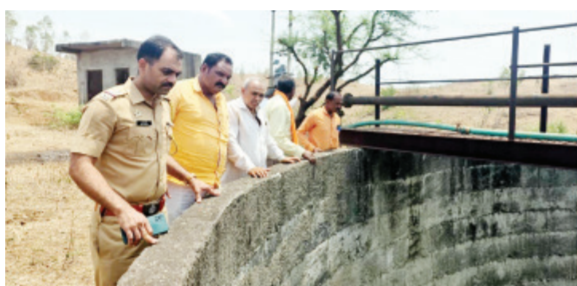
योजनेवर परिणाम होत असून पाणीटंचाईचा प्रश्न ऐरणीवर आला आहे. या वांवार होणाऱ्या चोरीमुळे ग्रामपंचायतीवर मोठा आर्थिक बोजा पडत असून आतापर्यंत

लिंबागणेश । प्रतिनिधी बीड तालुक्यातील लिंबागणेश गावात ग्रामपंचायतीमार्फत त सुरू असलेल्या पाणीपुरवठा योजनेतील विहिरीच्या मोटारीची विद्युत वायर गेल्या दीड महिन्यात तब्बल दोन वेळा चोरीला गेल्याने ग्रामस्थांमध्ये संतापाची लाट उसळली आहे. गावाच्या पिण्याच्या पाण्याचा मुख्य स्रोत असलेल्या या