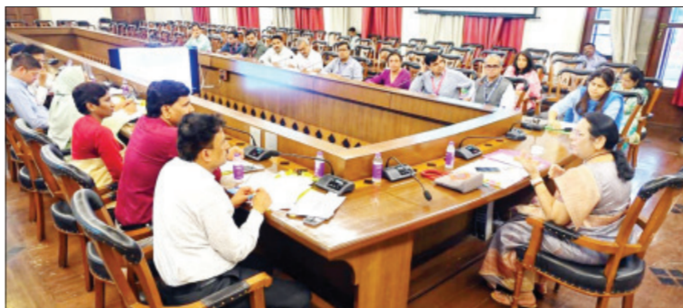
राज्य शासनाच्या विविध लोककल्याणकारी योजनांचा लाभ देण्यात यावे, असेही निदेश डॉ. गोहे यांनी दिले.

आले आहे. अशा प्रकारचे उपक्रम इतर जिल्ह्याने राबविते अशा सूचना डॉक्टर नीलम गोरे यांनी केल्या. राज्यशासनाने गर्भाशय काढून टाकण्याच्या शस्त्रक्रियासंदर्भात राज्यस्तरीय समिती पुर्नगठीत करण्यात आली आहे, या समितीचे कामकाज अधिक गतीने तसेच प्रभावीपणे होण्यासाठी लवकरात लवकर जिल्हास्तरीय समित्यांच्या कामाचे स्वरूप लवकरच ठरवण्याचा निर्णय विधान परिषदेच्या उभे सभापती डॉ. नीलम गोहे यांनी घेतला. ऊसतोड महिला कामगारांमध्ये आरोग्य विषयी व्यापक स्वरूपात जनजागृती करावी तसेच केंद्र व