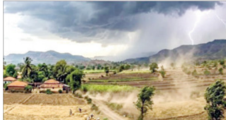
ठिकाणी रस्ते पाण्याखाली गेल्याने वाहतूक कोंडी दिसून आली. पुणे जिल्ह्याच्या अनेक भागांमध्ये सर्वत्र मध्यम ते जोरदार पाऊस तसेच काही ठिकाणी गारपीट झाल्याने

राज्यातील अनेक भागात अवकाळी पावसाचे धुमशान सुरुच आहे. पुण्यातील पश्चिम भागात सोमवारी वादळी चान्यासह गारांचा पाऊस झाला. तसेच उत्तर महाराष्ट्रातील धुळे, नाशिक जिल्ह्याला पावसाने झोडपले. यामुळे कांदा, गहू, हरभरा, मका पिकांचे नुकसान होण्याची शक्यता आहे.