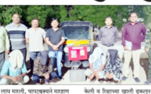
चाकु मारून लाथ मारली, चाचटयुक्ताने मारहाण केली व रिश्ताच्या खाली डकलून दिले म्हणून

जाल असताना अज्ञात रिश्ता चालक व ईतर चार अज्ञात इसम यांनी रिश्ता मंडा चौफुली येथे न येता रिश्तावाडी रोडवर कळ्या रस्त्याने नेऊन रिश्ताचालकासह रिश्तात बसलेल्या चार अज्ञात इसमांनी फिर्दावीच्या शर्टाच्या खिशातील रु.७०००/- किंमतीचा रेडमी कंपनीचा मोबाईल व पॅन्टच्या खिशातील रु.५५००/- रोख रक्कम काढून घेतली व फिर्दावी जखळील कोठ्या कामकाजाची ब्रिफकेस हिस्कावून घेतली. फिर्दावीने प्रतिकार केला असता यातील अज्ञात रिश्ता चालकाने त्याचे जखळील लोखंडी चाकुने फिर्दावीच्या टाक्या हाताच्या तळहातावर भांगण दुखवत केली. तसेच फिर्दावीच्या छातीवर सुद्धा