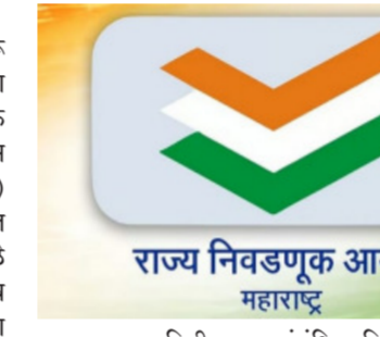
राज्य निवडणूक आयोग महाराष्ट्र

परभणी । प्रतिनिधी परभणी विधानसभा मतदारसंघात सुरू असलेल्या मतदार यादी सखोल पुनरीक्षण (एसआयआर) मोहिमेदरम्यान निवडणूक कर्तव्यात हलगर्जीपणा करणाऱ्या मतदान केंद्रस्तरीय अधिकाऱ्यांविरुद्ध (बीएलओ) तहसील प्रशासनाने कडक कारवाई करत गुन्हा दाखल केला आहे. या घटनेमुळे निवडणूक प्रक्रियेतील शिस्त व जबाबदारीबाबत प्रशासनाचा कठोर संदेश पुन्हा एकदा अधोरेखित झाला आहे.