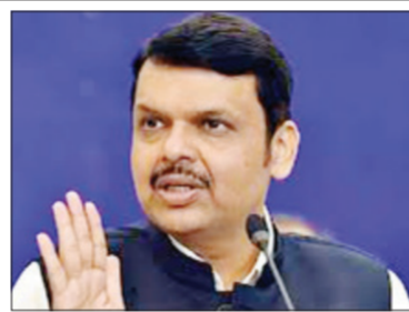
अप्रमाणित माहितीवर विश्वास ठेवू नये आणि ती पुढे पाठवू नये, असे आवाहन केले. दरम्यान, केंद्र सरकारने सर्वसामान्यांना दिलासा देत पेट्रोल आणि डिझेलवरील उत्पादन शुल्क (एक्साइज ड्यूटी) प्रति लिटर १० रुपयांनी कमी

खोटी माहिती पसरवणे हा गुन्हा आहे. अशा प्रकरणांमध्ये संबंधित व्यक्तींवर कडक फौजदारी कारवाई केली जाऊ शकते. नागरिकांनी जबाबदारीने वागवे,