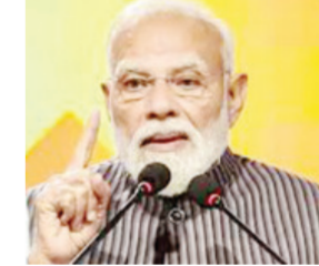
पेट्रोलवरील सुधारित उत्पादन शुल्क २१.९० रुपये प्रति लिटरवरून ११.९० रुपये प्रति लिटरपर्यंत कमी करण्यात आले आहे. त्यामुळे दोन सप्ताहात सरकारचा १,५०० कोटी >> पान २ वर