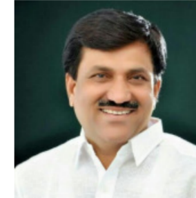
मुख्यमंत्री व महसूल मंत्री यांचे लोणीकरांनी मानले आभार

व्यावसायिक वापरासाठी असलेल्या घरांना नियमित करता येणार असून फक्त निवासी वापरासाठी असलेल्या घरांना नियमित करण्यात येणार आहे असेही या पत्रकात नमूद करण्यात आले आहे