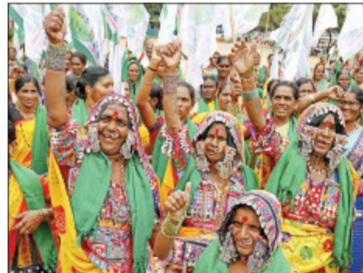
मागणी प्रलंबित आहे. 'हैद्राबाद गॅझेटियर' मधील उल्लेखाच्या आधारे समाजाने ही मागणी अधिक आक्रमकपणे

गेल्या अनेक दशकांपासून बंजारा समाजाची एसटी प्रवर्गात समावेशाची