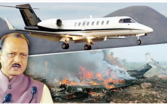
नॉन-शेड्युल्ड/व्हीआयपी फ्लाइटने रनवे ११ वर लँडिंगचा प्रयत्न केला. पहिल्या प्रयत्नात 'गो अरॉउंड' करण्यात आला. दुसऱ्या प्रयत्नात पायलटने