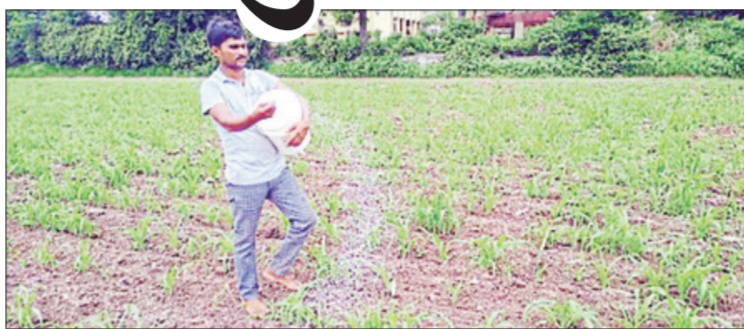
सुरू होत असल्याने दरवाढीचा परिणाम शेतकऱ्यांच्या नियोजनावर आणि

आगामी खरीप हंगामाच्या पार्श्वभूमीवर रासायनिक खतांच्या दरात झालेल्या मोठ्या वाढीमुळे राज्यातील शेतकऱ्यांपुढे गंभीर आर्थिक संकट उभे राहण्याची चिन्हे दिसत आहेत. खतांच्या किमतीमध्ये सरासरी १५ टक्क्यांपर्यंत वाढ झाल्याचे दिसून येत असून, यामुळे शेतकरी एकूण उत्पादन खर्च मोठ्या प्रमाणात वाढणार आहे. खरीप हंगामातील पेरणी जूनमध्ये होत असली तरी मे महिन्यापासूनच खतांची खरेदी