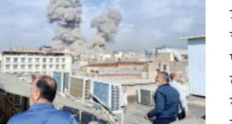
आहेत. इराणने बॅलेस्टिक क्षेपणास्त्रं डागली आहेत. इस्रायलवर हल्ला चढवला आहे. त्याचवेळी मध्य पूर्वेतील अमेरिकेच्या तळनांदेखील लक्ष्य केलं आहे. कतार, बहारेन, यूएई, सौदी अरेबियामध्ये अमेरिकेचे लष्करी तळ आहेत.

इस्रायल आणि अमेरिकेने इराणवर हल्ला केल्यानं मध्य पूर्वेतील परिस्थिती बिघडली आहे. इराणने अमेरिका आणि इस्रायल यांच्या विरोधात युद्धाची घोषणा करत प्रतिहल्ले सुरू केले