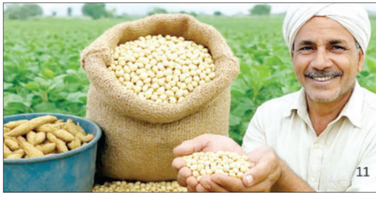
मिळणार आहे. ही खरेदी 'किंमत आधार

या निर्णयामुळे लाखो शेतकऱ्यांना त्यांच्या पिकांना किफायतशीर दर मिळणार असून, बाजारातील दरकपातीपासून संरक्षण