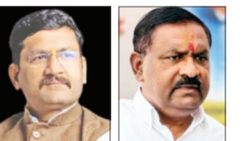
बीड | प्रतिनिधी