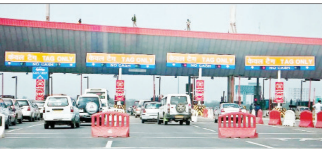
दिल्ली | वृत्तसंस्था

भारतीय राष्ट्रीय महामार्ग प्राधिकरणाने टोल वसुलीच्या नियमात मोठा बदल केला असून, १ एप्रिल पासून देशातील सर्व टोल