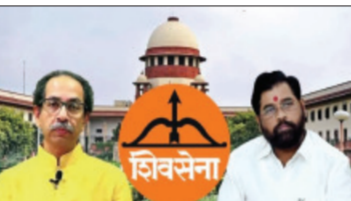
गटाला युक्तिवादासाठी दीड तासांचा वेळ मिळू शकतो. त्यानंतर शिवसेना शिंदे गट त्यावर आपले मत मांडेल. केंद्रीय निवडणूक आयोगाने फेब्रुवारी २०२३ मध्ये एकनाथ शिंदे यांच्या पक्षाला शिवसेना नाव आणि चिन्ह दिले होते. पक्ष नाव आणि चिन्ह यासाठी शिवसेनेच्या ठाकरे आणि शिंदे गटात गेली तीन वर्षांहून अधिक काळ न्यायालयीन लढाई सुरु आहे. शिवसेना ठाकरे गटाने जुलै २०२५ मध्ये सर्वोच्च न्यायालयात पक्ष नाव आणि चिन्हा निर्णयासंदर्भात अंतरिम अर्ज केला होता. यामध्ये महाराष्ट्रात आगामी स्थानिक स्वराज्य संस्थांच्या

१२ मार्च रोजी संबंधित प्रकरणासाठी १ एप्रिल ही तारीख दर्शवण्यात आली होती. मात्र आता सुनावणी पुढे ढकलण्यामुळे ठाकरे गटाचा पुन्हा एकदा हिरमोड झाला आहे. दरम्यान, या प्रकरणात अंतिम युक्तिवाद बाकी आहे. २३ एप्रिलला सुनावणी झाल्यास शिवसेना ठाकरे गट सर्वप्रथम बाजू मांडण्याची शक्यता आहे. सूत्रांच्या माहितीनुसार ठाकरे