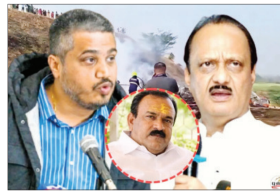
महटले आहे की, जादूटोणासारख्या अंधश्रद्धांना महाराष्ट्र कधीही शीक घालत नाही. मात्र अशा प्रकारच्या भोंदूगिरीमागील कलुषित हेतू

रोहित पवार यांनी सोशल मीडियावर केलेल्या पोस्टमध्ये