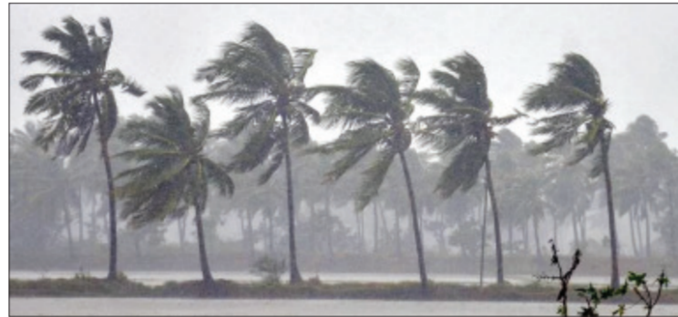
कोलंबिया विद्यापीठ आणि नासा यांच्या अहवालानुसार, पॅसिफिक महासागरातील ला निनाचा प्रभाव आता

२०२६ च्या शेवटच्या सहा महिन्यांत एल निनो येण्याची शक्यता आहे. ऑगस्ट ते नोव्हेंबर या काळात एल निनो येण्याची शक्यता ६० टक्के असल्याचा अंदाज हवामान विभागाने वर्तवला आहे. यापूर्वी हा अंदाज ५०% होता, मात्र आता त्यात वाढ झाली आहे. साधारणपणे एल निनो सक्रिय असणाऱ्या वर्षात भारतात पाऊस कमी पडतो आणि उन्हाळ्याचा तडाखा जास्त जाणवतो. हवामानाचा नवीन अंदाज देशातील बळीराजाची चिंता वाढविणारा आहे.