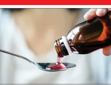
जोडल्यानंतर, ज्यामुळे 'जगातील फार्मसी' म्हणून त्यांची प्रतिष्ठा कमी झाली आहे, ४२ अब्ज डॉलर्सच्या फार्मा उद्योगावर देखरेख वाढवण्याचा दबाव एजन्सीवर