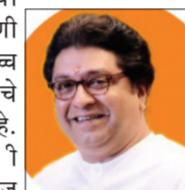
कायद्यालयावर मनसेशी संबंधित सुमारे ३० व्यक्तींनी तोडफोड करण्याचा प्रयत्न केला. तसेच समाजमाध्यमांवर पोस्ट करून त्यांना धमक्या देण्यात आले.