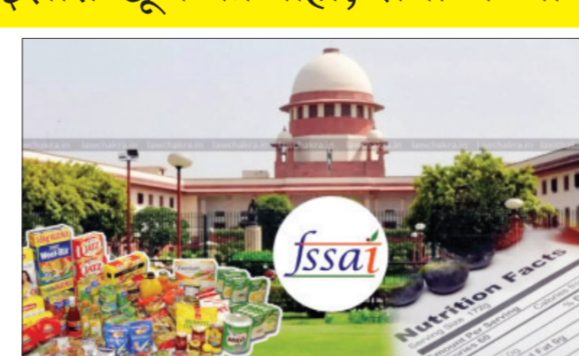
याचिका दाखल केली आहे. पॅकेज्ड फूडच्या पाकिटावर साखर, मीठ आणि चरबी यांचे प्रमाण किती आहे, याचा स्पष्ट इशारा समोरच्या बाजूला असायला हवी, अशी मागणी या याचिकेतून करण्यात आली आहे.

बाजारात विक्री होणाऱ्या पाकीटबंद (बिस्किटे, चिप्स, शीतपेये इ.) पदार्थांमध्ये असणाऱ्या साखर, मीठ आणि चरबीच्या घातक प्रमाणाबद्दल पाकिटावर स्पष्ट इशारा असावा, अशी मागणी करणाऱ्या याचिकेवर सर्वोच्च न्यायालयात सुनावणी सुरू आहे. याप्रकरणी भारतीय अन्न सुरक्षा आणि मानक प्राधिकरणाने दिलेल्या उत्तरावर सर्वोच्च न्यायालयाने तीव्र नाराजी व्यक्त केली आहे. ३ एस आणि अवर हेल्थ सोसायटी या संस्थेने एक जनहित