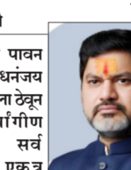
महाशिवरात्रीच्या पावन पर्वावर राज्याचे मंत्री धनंजय मुंडे यांनी मतभेद बाजूला ठेवून बीडच्या सर्वांगीण विकासासाठी सर्व लोकप्रतिनिधींनी एकत्र येण्याचे आवाहन केले.

महाशिवरात्रीच्या पावन पर्वावर राज्याचे मंत्री धनंजय मुंडे यांनी मतभेद बाजूला ठेवून बीडच्या सर्वांगीण विकासासाठी सर्व लोकप्रतिनिधींनी एकत्र येण्याचे आवाहन केले. यावेळी त्यांनी प्रभू वैद्यनाथ मंदिर येथे दर्शन घेतले. दर्शनानंतर त्यांनी राज्यातील जनतेचे जीवन सुखी, समाधानी व समृद्ध राहावे यासाठी महादेवाकडे प्रार्थना केली. बीडच्या विकासासाठी पान २ वर