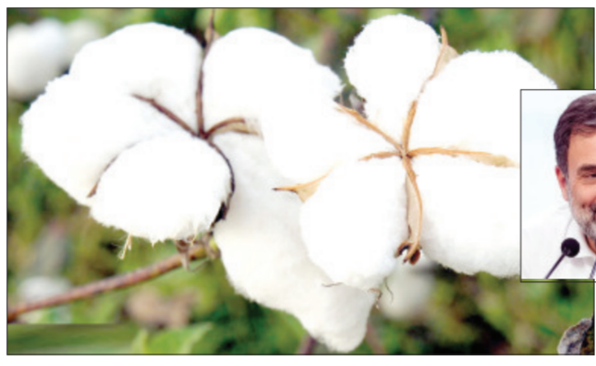
असल्याचा हल्लाबोल केला.

लोकसभेतील विरोधी पक्षनेते राहुल गांधी यांनी भारत-अमेरिका व्यापार धोरणात कापूस आणि गारमेंट्सवरून पंतप्रधान नरेंद्र मोदी, वाणिज्य मंत्री पियूष गोयल यांच्यासह कॅबिनेटवर जोरदार हल्ला चढवला आहे. अमेरिकेसोबत झालेला व्यापार करार हा कापूस उत्पादक शेतकरी आणि गारमेंट्स उद्योगाला 'धोका' देणारा करार केल्याचा आरोप करत राहुल गांधी यांनी केंद्र सरकारवर भ्रम परसवत