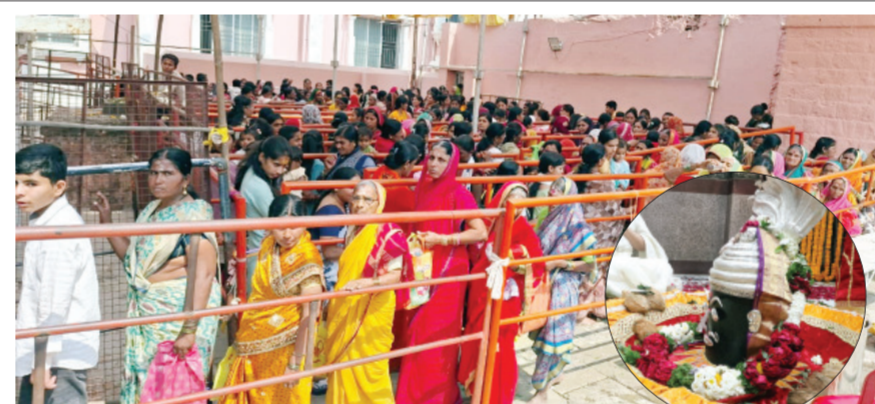
परळी व. बा. ज्योतीरलिंगापैकी एक असलेल्या परळी येथील प्रभु वैद्यनाथाच्या दर्शनासाठी महाशिवरात्रीनिमित्त पहाटे पाच पासून भाविकांनी रांगा लावल्या होत्या. राज्यभरातून भाविकांनी मोठी गर्दी केली होती त्यावेळी हर हर महादेव या घोषणांनी प्रभुवैद्यनाथाचा परिसर दणाणून गेला होता.