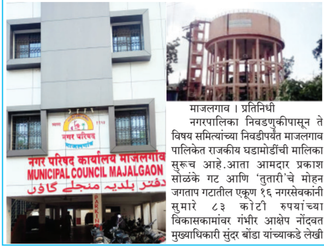
नगर परिषद कार्यालय माजलगाव

पाईपलाईन काम तात्काळ थांबवण्याची मागणी; अन्यथा तीव्र आंदोलनाचा दिला इशारा