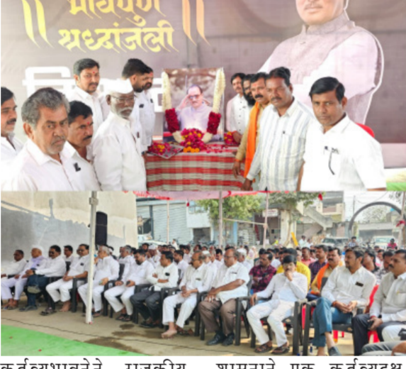
कर्तव्यभावनेने राजकीय, सामाजिक व शासकीय कर्तव्य पार पाडले. त्यांच्या निधनाने राज्य

वडवणी । प्रतिनिधी महाराष्ट्राचे लाडके उपमुख्यमंत्री ना.अजित दादा पवार यांच्या अकाली निधनानंतर वडवणी तालुक्यातील सर्वपक्षीय व नागरिकांच्या वतीने येथील कृषी उत्पन्न बाजार समितीच्या प्रांगणात शनिवार दि. ३१ जानेवारी २०२६ शनिवार रोजी शोकसभा आयोजित करण्यात आली होती. यावेळी संपूर्ण राजकीय - नेते, सामाजिक कार्यकर्ते यांनी - गहिवरल्या भावनेने लाडक्या दादांना श्रद्धांजली वाहण्यात आली. महाराष्ट्राचे उपमुख्यमंत्री तथा बीड जिल्ह्याचे पालकमंत्री ना. अजित दादा पवार यांनी आपल्या संपूर्ण सेवाकाळात रहमी प्रामाणिकपणे, निष्ठेने आणि