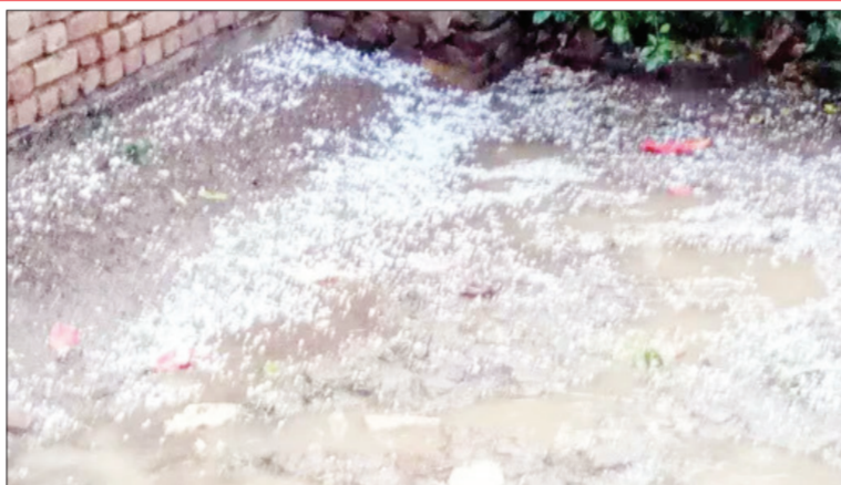
शेतकऱ्यांना तात्काळ आर्थिक सहाय्य देण्याची मागणी केली आहे. भाजप