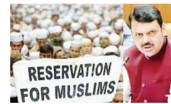
आहे. ज्याने सरकारच्या या निर्णयाला असंवैधानिक आणि सांप्रदायिकदृष्ट्या प्रेरित म्हटले आहे.

मुस्लिम समुदायासाठी ५ टक्के आरक्षण रद्द करण्याच्या महाराष्ट्र सरकारने अलिकडेच घेतलेल्या निर्णयामुळे एक नवीन कार्यदेशीर आणि राजकीय वाद निर्माण झाला आहे. राज्य सरकारने मंगळवार, १७ फेब्रुवारी २०२६ रोजी सरकारी नोकऱ्या आणि शैक्षणिक संस्थांमध्ये मुस्लिम समुदायासाठीचा कोटा रद्द करण्याचा सरकारी निर्णय जारी केला. या निर्णयाला आता मुंबई उच्च न्यायालयात आव्हान देण्यात आले