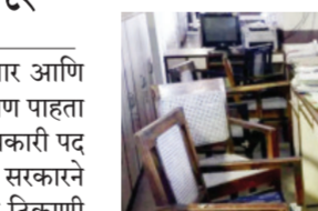
झाला आहे. प्रशासकीय कामांवरचा ताणही वाढला आहे. जिल्ह्यांचे भौगोलिक क्षेत्राबरोबर लोकसंख्याही वाढली आहे. त्यामुळे जिल्ह्याच्या ठिकाणी जाण्यासाठी ग्रामीण भागातील नागरिकांना अंतर वाढलेले आहे. त्यामुळे राज्यात अपर जिल्हाधिकाऱ्यांची ११ पदे निर्माण करण्यात यावीत, अशी एका

पुणे जिल्ह्याचा वाढता विस्तार आणि प्रशासकीय यंत्रणेवरील वाढता ताण पाहता पुणे जिल्ह्यात अतिरिक्त जिल्हाधिकारी पद निर्माण करण्याच्या प्रस्तावाला सरकारने मान्यता दिली आहे. पुण्यात दोन ठिकाणी पदे निर्माण करण्याचा प्रस्ताव असताना केवळ एकच बारामती येथेच पदनिर्मितीला सरकारने मान्यता दिली. त्यामुळे आंबेगावला दुसरे अतिरिक्त जिल्हाधिकारी पद देण्याऐवजी चाकण येथे गर्दीच्या आणि वर्दळीच्या भागासाठी अपर तहसील कार्यालय निर्माण करण्यात आले आहे. राज्यातील अनेक जिल्ह्यांचा विस्तार