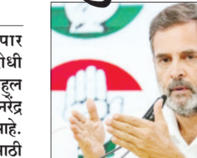
पोस्ट केली आहे. त्यात त्यांनी भारत-अमेरिका करारावरून संसदेत केलेल्या भाषणात जिउ-जित्से उदाहरण का दिले? यावर त्यांनी भाष्य केले आहे. कारण त्या खेळात एखाद्याला पकडून

गांधी यांनी याबाबत शुक्रवारी सोशल मीडिया प्लॅटफॉर्म एक्सवर एक