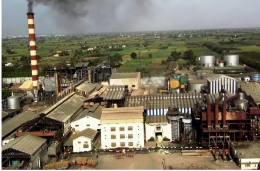
पिळवणूक होत होती. अशा अनेक तक्रारी दाखल झाल्यानंतर साखर आयुक्तालयाने अशा कारखान्यांकडून १० कोटी रुपयांची बँक गॅरंटी घेण्यात यावी. यातून शेतकऱ्यांची थकीत एफआरपी

बँक गॅरंटीतूनही रक्कम न देता आल्यास संबंधितांच्या स्थावर व जंगम मालमतेमधून ही रक्कम वसूल करण्याचे अधिकार जिल्हाधिकाऱ्यांना दिले आहेत. राज्यातील आर्थिकदृष्ट्या आजारी, अवसायनात असलेले सहकारी साखर कारखाने खासगी कंपनी, संस्थान भागीदारी, सहयोगी आणि भाडेतत्वावर चालविण्यास देण्यात आलेले आहेत. मात्र, या साखर कारखान्यांकडून गाळप हंगामाकरिता शेतकऱ्यांना एफआरपीची रक्कम विशिष्ट मुदतीमध्ये न दिल्यास सहकार विभागाला कारवाईचा अधिकार नव्हता. त्यामुळे अशा कारखान्यांवर अंकुश नव्हता. परिणामी शेतकऱ्यांची