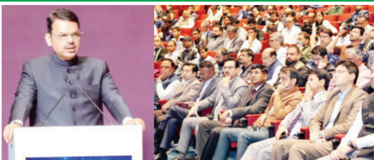
नवी दिल्लीतील भारत मंडपम येथे सुरू असलेल्या इंडिया एआय इम्पॅक्ट समिटी -२०२६ मधील एआय इन अॅग्रिकल्चर

कृषी क्षेत्रात आर्टिफिशिअल इंटेलिजन्सच्या सहाय्याने अन्न सुरक्षितता, वातावरणातील बदलाला सामोरे जाण्याची क्षमता, महिला सक्षमीकरणसह सर्वांगीण समृद्धी आणण्यासाठी महाराष्ट्र शासन प्रयत्न करीत असल्याचे मुख्यमंत्री देवेंद्र फडणवीस यांनी शुक्रवारी येथे सांगितले. आर्टिफिशिअल इंटेलिजन्सचा वापर ही बाब केवळ प्रदर्शन आणि चर्चेपुरती मर्यादीत न राहता ती मोठ्या संख्येने लोकांपर्यंत पोहोचण्याची गरजही मुख्यमंत्र्यांनी प्रतिपादित केली.