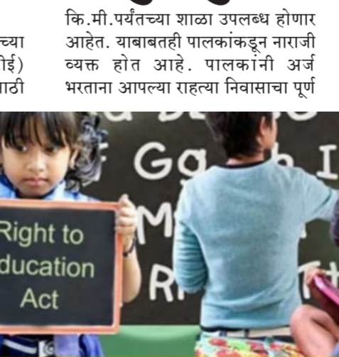
कि.मी.पर्यंतच्या शाळा उपलब्ध होणार आहेत. याबाबतही पालकांकडून नाराजी व्यक्त होत आहे. पालकांनी अर्ज भरताना आपल्या राहत्या निवासाचा पूर्ण

लिहिलेला मोबाइल नंबर आणि अर्जाची प्रत स्वतः जवळ लॉटरी प्रक्रिया होईपर्यंत जपून ठेवावी लागणार आहे. आरटीई प्रवेशासाठी राज्यातील ८ हजार ६५१ शाळांनी नोंदणी केली असून, त्यात १ लाख १२ हजार ७७२ प्रवेशांच्या जागा उपलब्ध झालेल्या आहेत. यासाठी १२ हजार १५६ अर्ज दाखल झाले आहेत. पुणे जिल्ह्यातील १०५ शाळांमध्ये १७ हजार ५०९ प्रवेशांच्या जागा उपलब्ध झाल्या आहेत. त्यासाठी १७ हजार ६७१ अर्ज दाखल झाले आहेत. पालकांना आपल्या बालकांचे अर्ज दाखल करण्यासाठी १० मार्चपर्यंत मुदत देण्यात आलेली आहे.