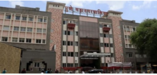
क्षेत्रीय कार्यालयांची संख्या वाढेल, अशी अपेक्षा व्यक्त केली जात होती. तर क्षेत्रीय कार्यालयांची संख्या ही लोकसंख्येनुसार करावी, अशी कायद्यात तरतूद आहे. त्यानुसार २४ लाख लोकसंख्येसाठी १२ क्षेत्रीय कार्यालये तर त्यानंतरच्या प्रत्येक सहा लाख लोकसंख्येसाठी एक क्षेत्रीय कार्यालय असावे, असा नियम आहे. महापालिकेचे

पुणे । प्रतिनिधी मिनी महापालिका म्हणून ओळखल्या जाणाऱ्या क्षेत्रीय कार्यालयांच्या प्रभाग समित्यांचे अध्यक्ष मिनी महापौर म्हणून ओळखले जातात. या १५ प्रभाग समित्यांमधील १४ समित्यांवर भाजपचे अध्यक्ष असणार आहेत. तर केवळ एक प्रभाग समिती काँग्रेसच्या वाट्याला येणार आहे. तर महापालिकेत २७ नगरसेवक निवडून आल्यानंतरही राष्ट्रवादी काँग्रेसला एकही समिती मिळणार नसल्याचे स्पष्ट झाले आहे. प्रभाग रचनेप्रमाणेच प्रशासनाने केलेली प्रभाग समित्यांची रचनाही भाजपच्या पध्दत्यावर पडल्याचे चित्र आहे. तर महापालिका हद्दवाढ झाल्याने