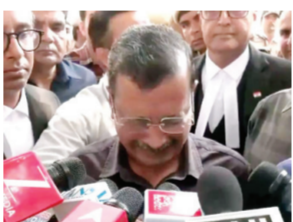
नवी दिल्ली । वृत्तसंस्था

दिल्लीतील कथित मद्य घोटाळ्याच्या आरोपातून राजूज