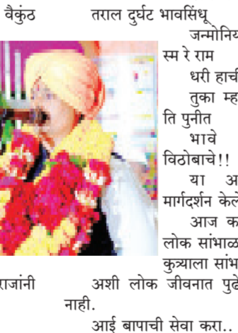
अशी लोक जीवनात पुढे जाऊ शकत आहे. आई बापाची सेवा करा..