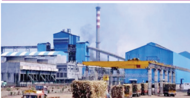
पुणे । प्रतिनिधी

साखरेच्या उत्पादन खर्चापेक्षा विक्रीची किंमत १० टक्क्यांनी कमी आणि त्यातच सरकारकडून इथेनॉलची खरेदीही कमी झाल्याने