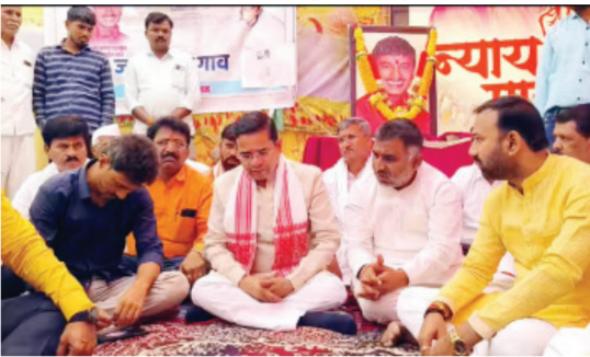
बीड | प्रतिनिधी