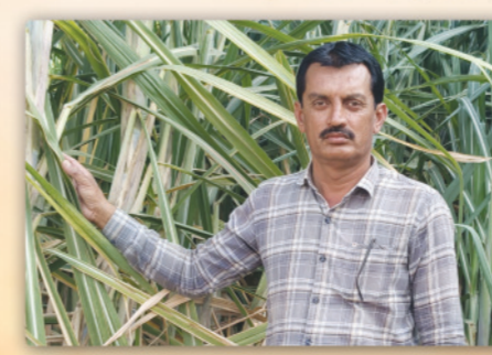
लहू गोरे आदर्श शेतकरी हिगणी बु.ता.जि.बीड