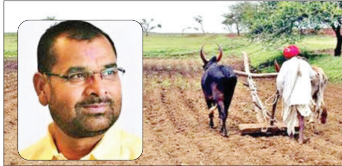
पुणे | प्रतिनिधी

सदाभाऊ खोत स्पष्टच म्हणाले, मला राज्यपाल करावे